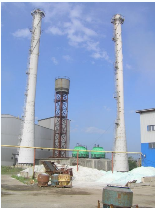
Дымовые трубы Н=50 м, Н=60 м, водонапорной башни 150 м 3

– методика расчета стальных дымовых труб с учетом локальных искривлений на основе численных и экспериментальных исследований процессов потери устойчивости оболочек, работающих в условиях сжатия с изгибом.