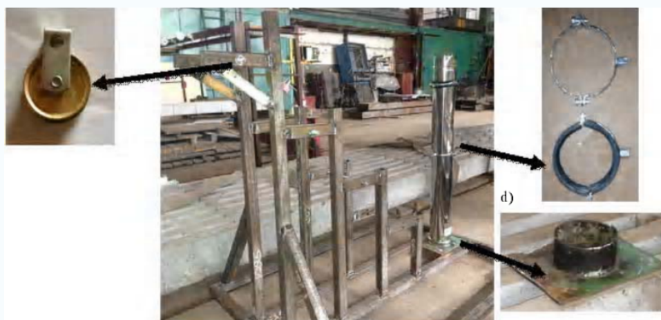
Общий вид лабораторной установки и главных конструктивных элементов: а – лабораторная установка с исследуемой моделью; б – шкив для передачи нагрузки; с – опорное кольцо; d – опорная часть