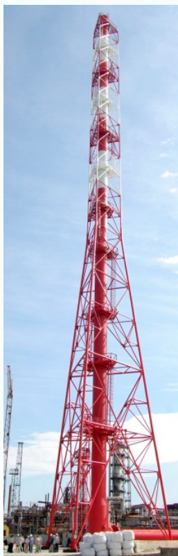
Дымовая труба 120 м

– методы повышения эффективности высотных сооружений с металлическим каркасом на основе планирования методов обслуживания на стадии проектирования.