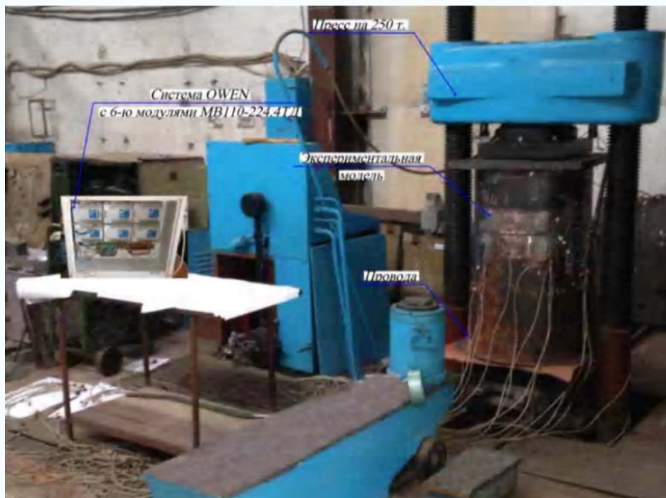
Общий вид испытательной установки для изучения влияния эксцентриситета стыковки цагг на напряженно-деформированное состояние оболочек металлических дымовых труб