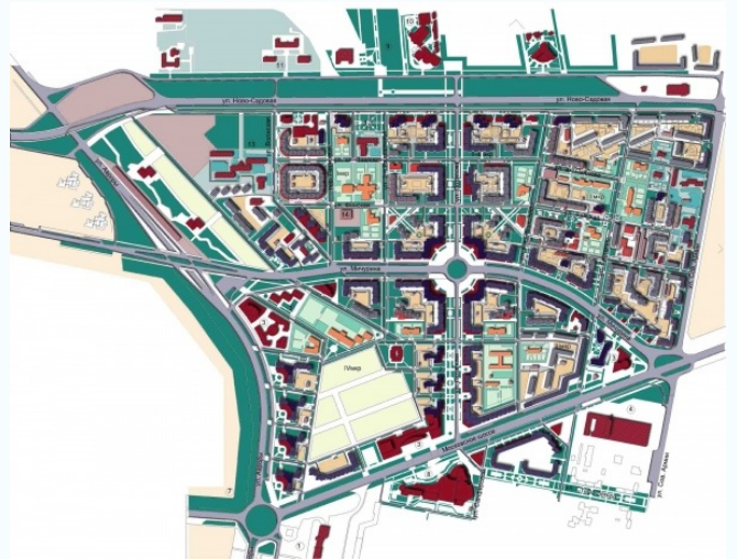
Пример градостроительных работ, создание трехмерных моделей с помощью географических редакторов