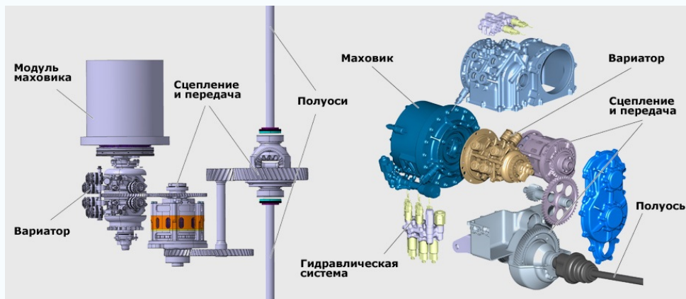
Одна из схем механической система рекуперации энергии автомобиля