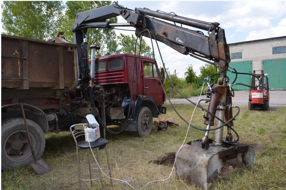
Испытание грейфера с приводным винтовым якорем