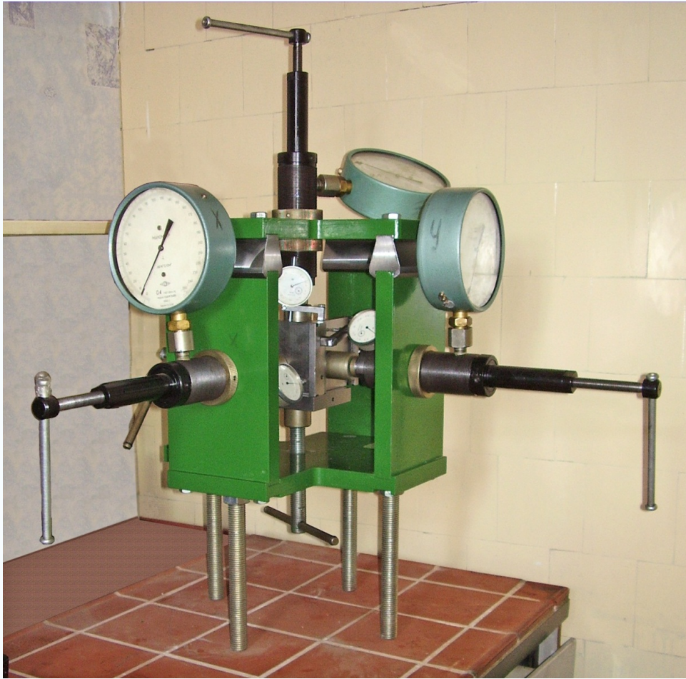
Прибор трехосного сжатия с независимым регулированием главных напряжений и деформаций