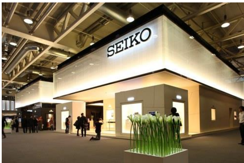
Рис. 1. Торговый павильон для производителей часов SEIKO Astron