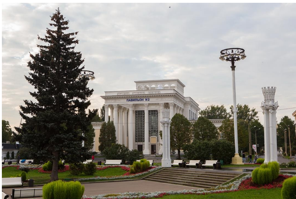
Рис. 5. Павильон №2 ВДНХ «Народное образование»

В 2014 году реставрация «Народного образования» стала частью программы возрождения ВДНХ.