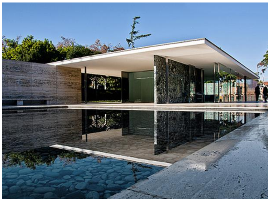
Рис. 3. Павильон Германии в Барселоне