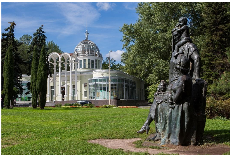
Рис. 6. Павильон №8 ВДНХ «Юные натуралисты»