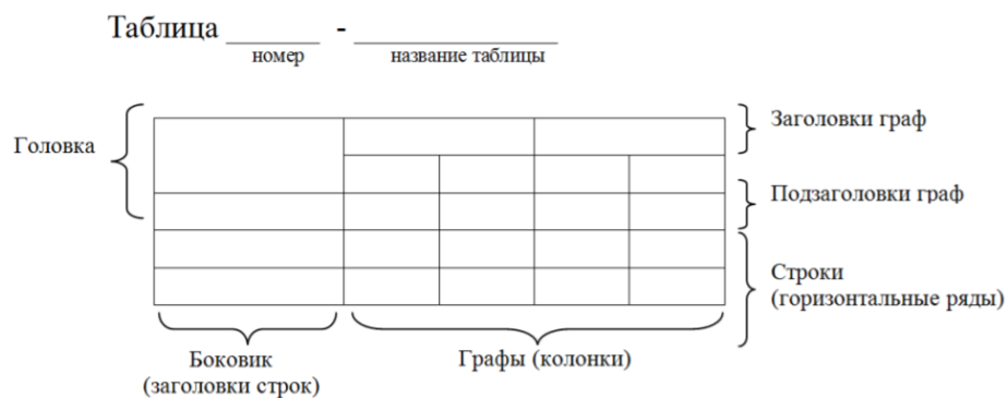
Рисунок 1 – Построение таблицы

6.2.32 Заголовки граф и строк таблицы следует оформлять с прописной буквы. Подзаголовки граф – со строчной буквы, если они составляют одно предложение с заголовком, или с прописной буквы, если они имеют самостоятельное значение. В конце заголовков и подзаголовков таблиц точки не ставятся. Заголовки и подзаголовки граф указываются в единственном числе. Слева, справа и снизу таблицы ограничиваются линиями. Разделение заголовков и подзаголовков боковика и граф диагональными линиями не допускается.