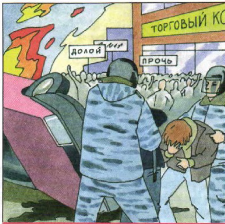
Демонстрация, которая переросла в хулиганские действия и беспорядки

Экстремизм – это приверженность отдельных людей или групп к крайним взглядам и поступкам, которые подспудно или непосредственно направлены против законных политических прав и свобод граждан, являются угрозой для гражданского мира, национального согласия и духовной, религиозной терпимости в обществе и государстве. Экстремистские взгляды и действия – это прямой путь к нарушению закона.