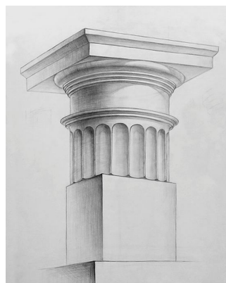
Рис. 1 Рисунок