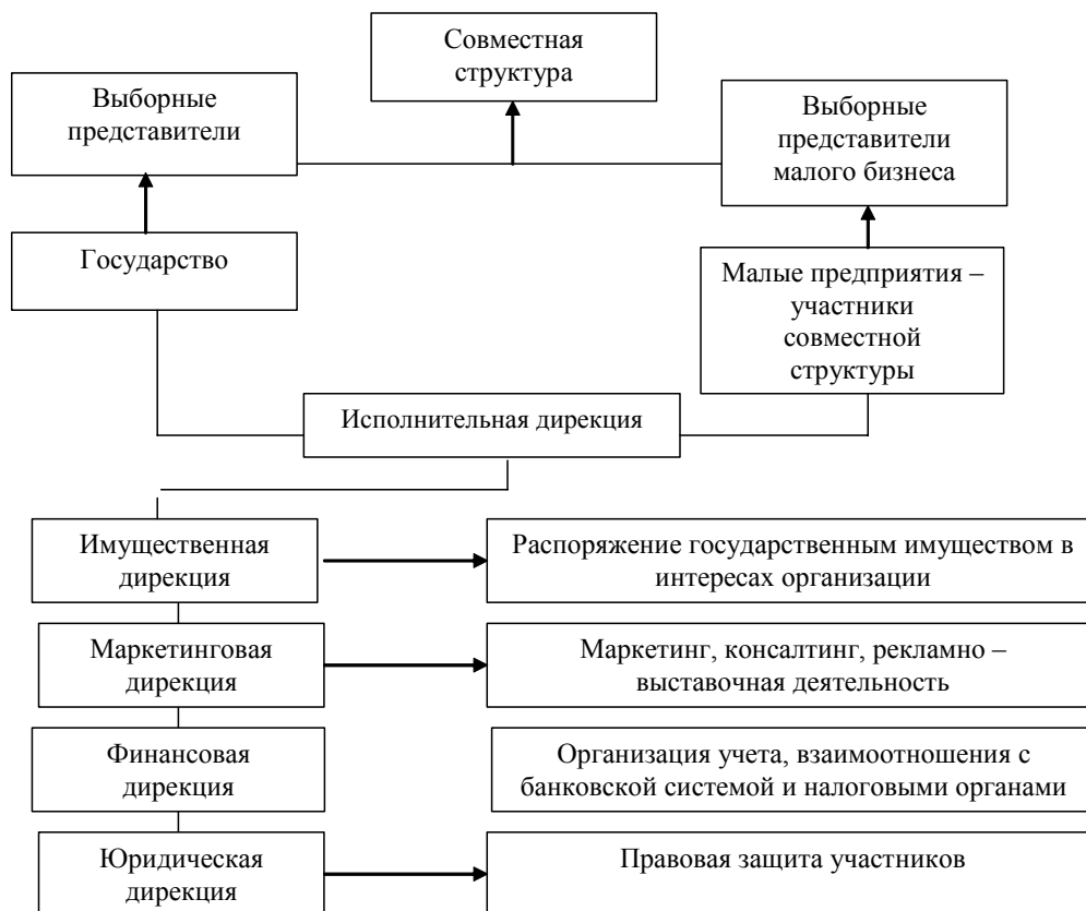
Рисунок 2. ОСУ ассоциированной структуры

При этом доход, полученный совместной структурой, целесообразно распределять в соотношении 50:50. 50% от результата деятельности