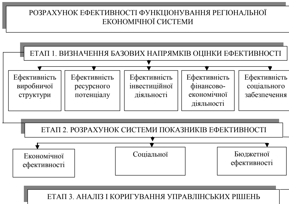
Рисунок 1. Етапи розрахунку ефективності функціонування регіональної економічної системи

Таким чином, послідовність оцінки ефективності складатиметься з трьох етапів: на першому етапі визначаються базові напрямки оцінки ефективності, на другому – розрахунок системи показників ефективності, на третьому – здійснюється аналіз і коригування управлінських дій з огляду на виявлені на попередніх етапах результати.