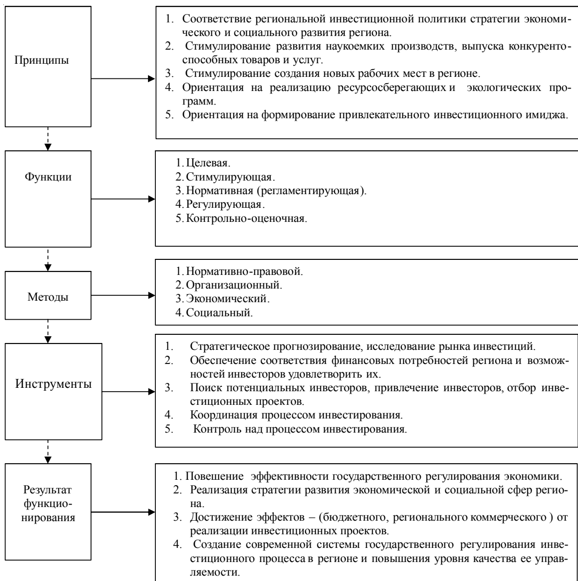
Рисунок 3. Аналитический инструментарий системы государственного регулирования инвестиционного процесса в регионе.

При этом базовые принципы создания и функционирования любых сложных социально-экономических систем регулирования при использовании их в системе государственного управления инвестиционным процессом в регионе наполняются специфическим функциональным содержанием, реализуемым через функции, методы и инструменты данной системы (табл. 1).