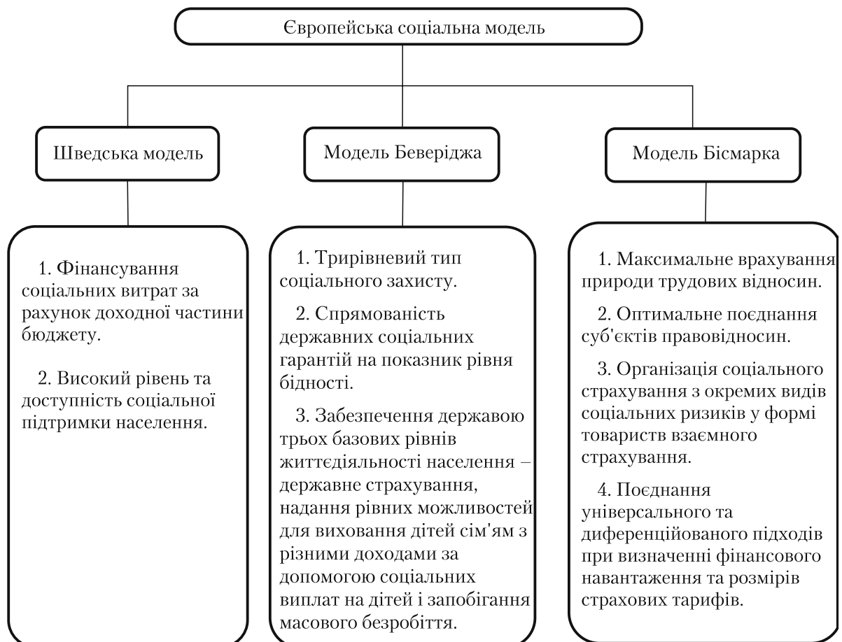
Рисунок 2. Європейські моделі соціального розвитку.

Перший етап (перша половина 90-х років) характеризувався патерналістською моделлю, запозиченою із практики регулювання соціальної сфери Радянського Союзу. Недоліками патерналістської моделі є перехресна реалізація