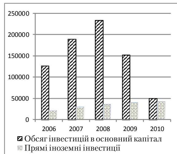
Рисунок 1. Динаміка залучення інвестицій в основний капітал та обсяг прямих іноземних інвестицій (тис. грн.).

Перебіг інвестиційного процесу в Україні засвідчує значні перепади у залученні інвестицій в основний капітал. Динаміка залучення інвестицій в основний капітал та обсяг прямих іноземних інвестицій наведені на рис. 1.