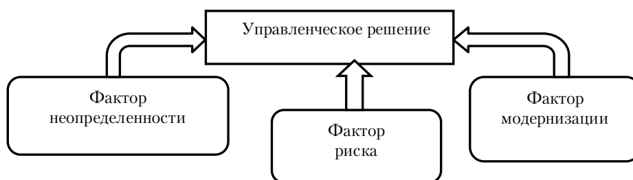
Рисунок 2. Факторы, влияющие на управленческие решения [8, с. 105].