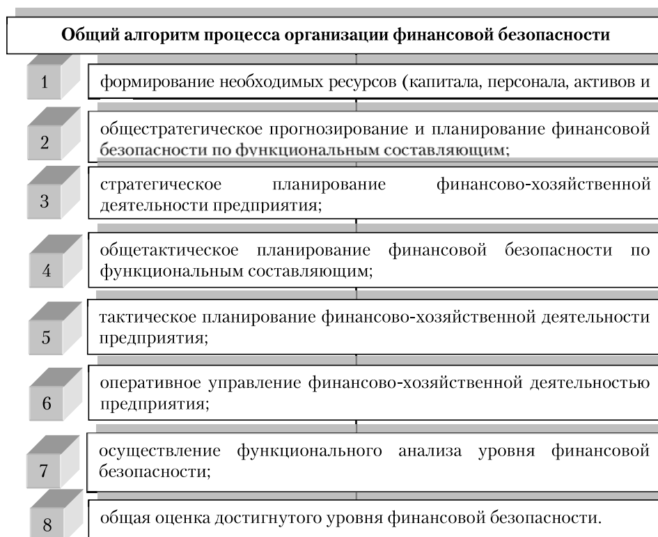
Рисунок 1. Общий алгоритм процесса организации финансовой безопасности [2].

Главная и функциональные цели определяют формирование необходимых системообразующих элементов и общего алгоритма процесса организации обеспечения финансовой безопасности. Данный алгоритм включает последовательность действий (мероприятий), представленных на рисунке 1, которые осуществляются последовательно или одновременно. Только при осуществлении в необходимом объеме отмеченных действий (мероприятий) можно будет достичь надлежащего уровня финансовой безопасности предприятия.