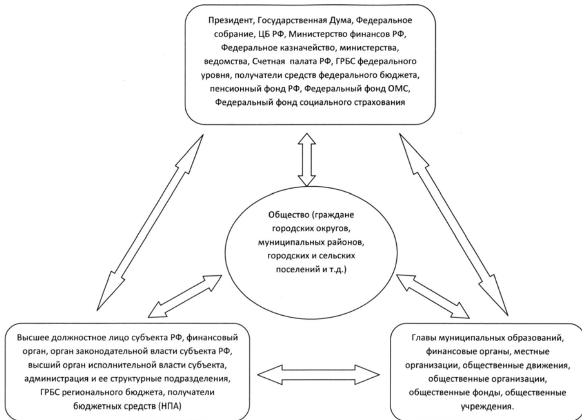
Рисунок 2. Структура системы публичного управления Российской Федерации [13].

Субъектами государственной власти в республике являются Президент, Парламент, Правительство и Суды;