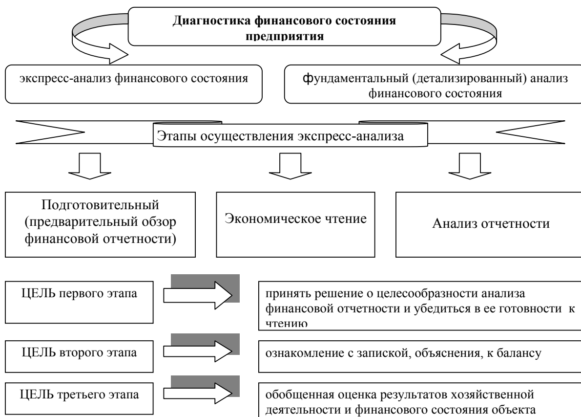
Рисунок 2 – Направления осуществления диагностики финансового состояния предприятия.