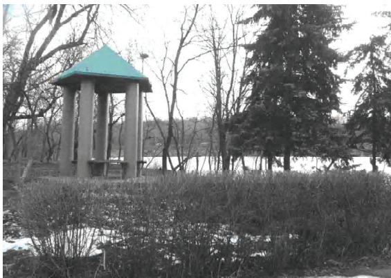
Рисунок 5. Вид на окружающий ландшафт в рекреационной зоне г. Донецка, демонстрирующий пример обустройства одного из популярных мест отдыха горожан среди природы.

Некоторые промежуточные результаты, полученные в процессе разработки обозначенных научных направлений, уже отражены в ряде опубликованных статей и итоговом отчёте по выполненной госбюджетной теме (К-2-01-11), а также внедрены в курсовое и дипломное проектирование на архитектурном факультете ДонНАСА. С учётом полученных научных результатов разработан ряд научно-практических рекомендаций и экспериментальных проектных предложений по реконструкции и новому строительству объектов социальной и инженерно-транспортной инфраструктуры в районах компактного проживания слепых в городах Донецке и Макеевке. Немаловажным внедрением промежуточных результатов по одному из обозначенных научных направлений следует считать, по мнению авторов статьи, разработанный и частично апробированный экспериментальный проект адаптации архитектурно-планировочных решений учебных корпусов ДонНАСА и прилегающих к ним территорий к потребностям молодёжи с