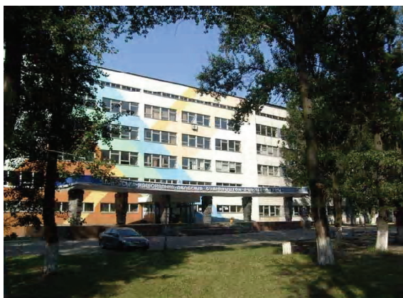
Рисунок 3. Вид на главный учебный корпус ДонНАСА со стороны улицы, демонстрирующий отсутствие каких-либо направляющих ориентиров, необходимых для лиц с выраженными нарушениями в сенсорной сфере (фото авторов, 2015 г.).