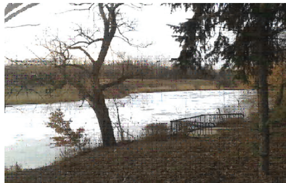
Рисунок 6. Вид на прибрежную зону одного из озер в районе Донецкого ботанического сада: с правой стороны можно видеть обустроенную смотровую площадку перед спуском к водоему.