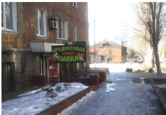
Рисунок 1. Вид на одну из улиц в районе компактного проживания слепых в г. Макеевке: на переднем плане можно видеть продовольственный магазин, на втором – двухэтажный жилой дом, построенный для работников предприятия УТОС в 1961 г. (фото авторов, 2016 г.).