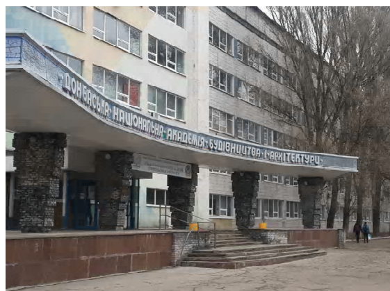
Рисунок 4. Фрагмент входа в главный учебный корпус ДонНАСА, демонстрирующий его недоступность для лиц, передвигающихся на инвалидных креслах-колясках, – недостаток, характерный для многих отечественных вузов (фото авторов, 2016 г.).

шениями в сенсорной сфере, то они фактически никак не освещены.