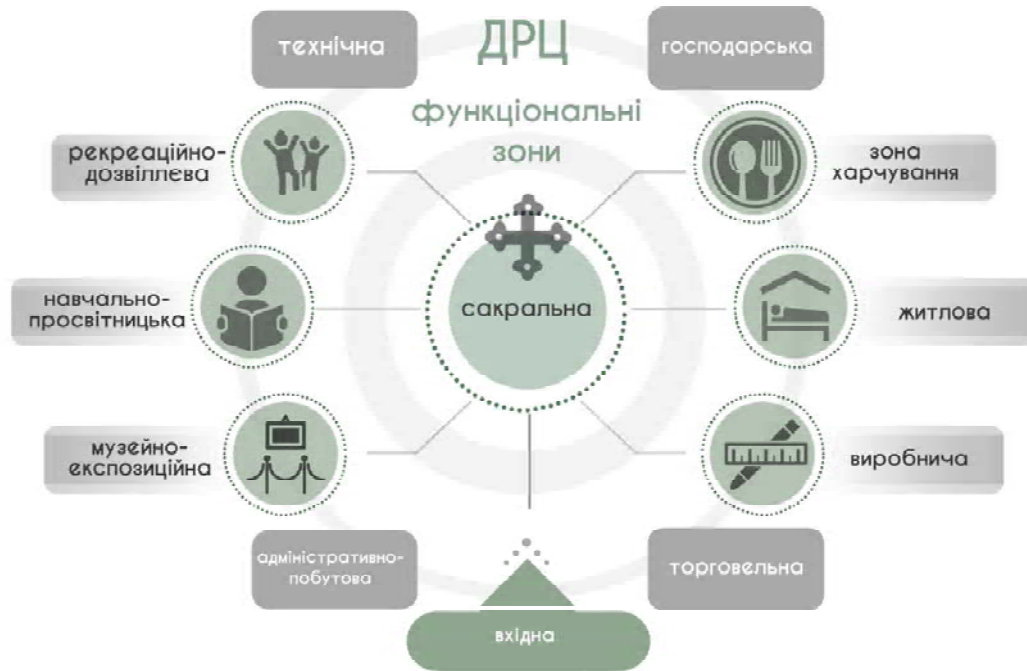
Рисунок 1. Типова схема функціонального зонування духовно-реколекційних центрів УГКЦ.

Рекреаційно-дозвіллеву зону доцільно доповнювати відкритими просторами, влаштувати озеленені тераси та дахи, зимові сади, відкриті лоджії з метою організації відпочинку та дозвілля у безпосередньому єднанні з природою, що суттєво розширить функціональну програму закладу. Такий підхід особливо стане в пригоді при проведенні на території ДРЦ молодіжних та дитячих християнських таборів.