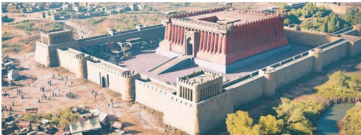
Рисунок 2. Мерв. Замок-кёшк, реконструкция. Большая Кыз-кала, VI в.

В этих условиях города тоже были прежде всего административными центрами многочисленных небольших владений и резиденцией правителя. В них была сосредоточена власть и управление – дворец правителя, административный аппарат и вооруженные отряды-дружины из молодых дихкан, чьи замки-усадыбы составляли главный объект монументального строительства за пределами города, а иногда и в нем самом. «Аристократическое дихканство представляло собой, видимо, высший слой городского населения, хотя их богатые дома не образовывали обособленных кварталов и соседствовали с лавками, мастерскими и жилищами менее престижного типа. Второе городское сословие состояло из купцов и владельцев ремесленных мастерских. Социальная структура среднеазиатского города V–VII вв., известная по немногим образцам, не подтверждает имущественную дифференциацию в расположении городских жилищ» [3, с. 10].