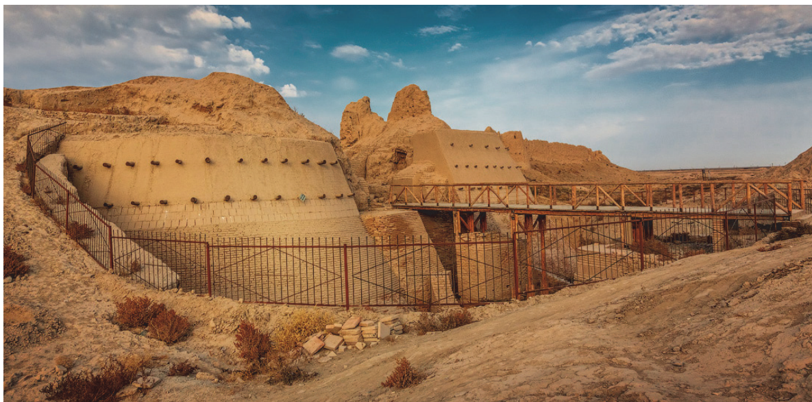
Рисунок 6. Крепостные стены Отрара (Южный Казахстан).

средними и более мелкими поселениями – спутниками, которые располагались практически вплотную друг к другу. «Отсутствие единой государственной религии в доисламский период способствовало развитию многообразия культовых сооружений в городах тюрков, где на равных правах сосуществовало множество верований: зороастризм и буддизм, манихейство и несторианское христианство, культ природы, земли, воды, неба и солнца – тенгрианство, а также культы предков и умерших, анимизм, тотемизм, фетишизм, шаманизм и др.» [15, с. 160].