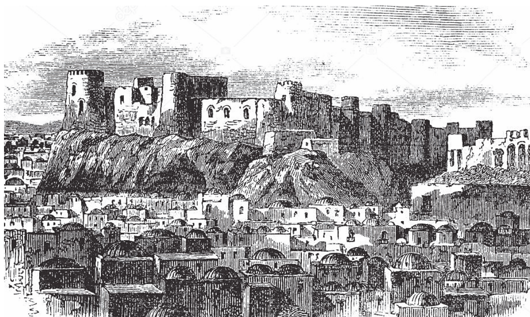
Рисунок 3. Цитадель в Герате (Афгани).

Очертания планов городов были связаны с рельефом местности (рис. 4). «Идеальный план