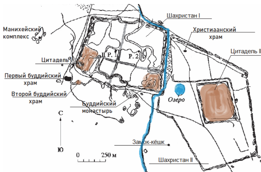
Рисунок 1. Суяб (городище Красная Речка, Кыргызстан). Развитие городской структуры, состоящей из двух шахристанов и двух цитаделей.

Однако не стоит забывать, что земли Центральной Азии в V–VIII вв. были раздроблены на небольшие государства, которые в свою очередь делились на еще более мелкие владения аристократов-дихкан (рыцарей), находящихся в вассальной зависимости от правителя (сюзерена). Необходимость удержать и защитить свои владения обусловила появление огромного количества по всей Центральной Азии монументальных дихканских замков-кешков и укрепленных сельских усадеб (рис. 2).