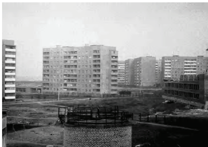
Рисунок 1 – Микрорайон Текстильщик [8].

Позже началось строительство панельных девятиэтажных и шестнадцатиэтажных домов. Были застроены свободные площади (микрорайон Текстильщик в Кировском районе города Донецка), а также территории уже существовавших микрорайонов, например микрорайона Широкий [7] (рис. 1, 2).