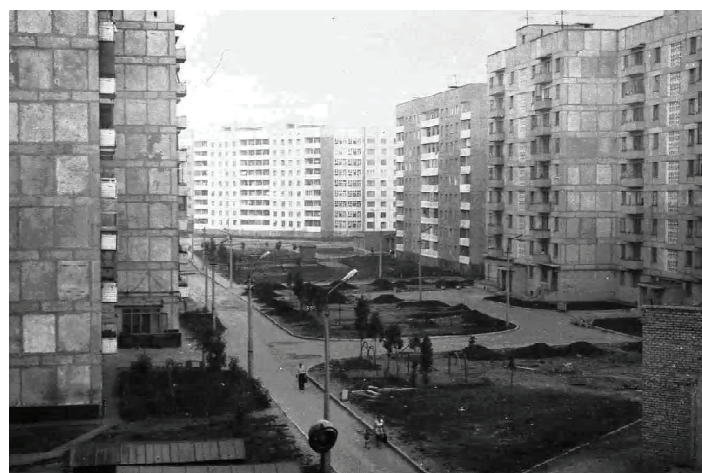
Рисунок 2 – Микрорайон Текстильщик [8].

В 1967 году в Донецке был образован Киевский район – один из самых промышленно развитых районов города на сегодняшний день, в 1973 году начал свое существование Ворошиловский район, который был выделен из состава Калининского района, а в 1980 году из состава Пролетарского района был выделен Буденновский район Донецка [7] (рис. 3).