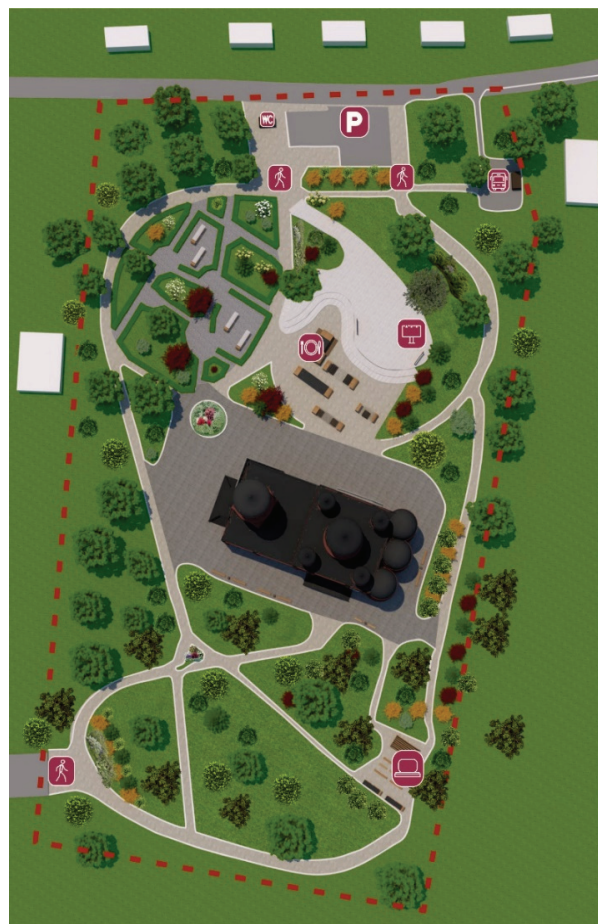
Рисунок 5 – Эскизный вариант планировки РТК Богоявленского храма села Коповка.