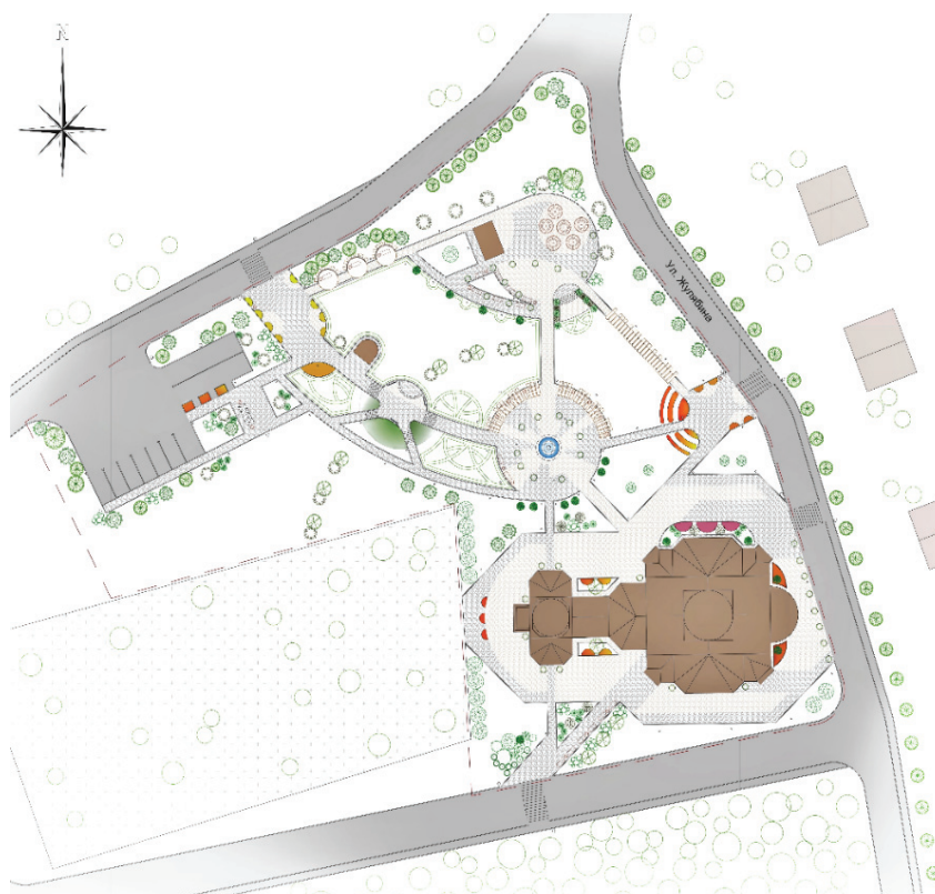
Рисунок 3 – Эскизный вариант планировки РТК Покровского храма села Усть-Каремша.

региона (рис. 3, 4, 5). Все четыре предложения имеют свой выразительный образ, учитывающий стилистику архитектуры храмов; функциональную логику, формирующую сценарий РТК и учитывающую градостроительную ситуацию и задачи богослужебного функционирования храмов. Характером благоустройства комплекса во всех предложениях подчеркивалась неразрывная связь архитектуры храма с окружающим природным ландшафтом, который дополняется и акцентируется предлагаемым набором растений.