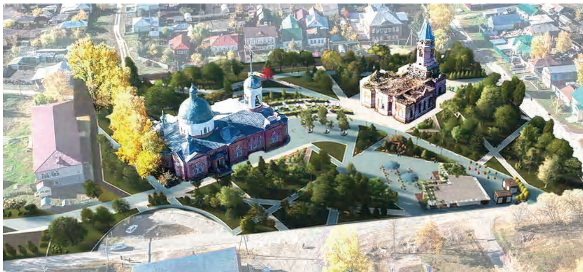
Рисунок 2 – Предложение по благоустройству центра и РТК на базе Никольского и Покровского храмов села Поим.

Предлагаемые РТК двух храмов села Поим и РТК Покровского храма города Нижнего Ломова расположены в центре села и являются значимой частью его общественного центра (рис. 2). Их формирование решает, помимо поставленных рекреационно-туристических задач, вопросы благоустройства центра поселения и организацию зон досуга жителей.