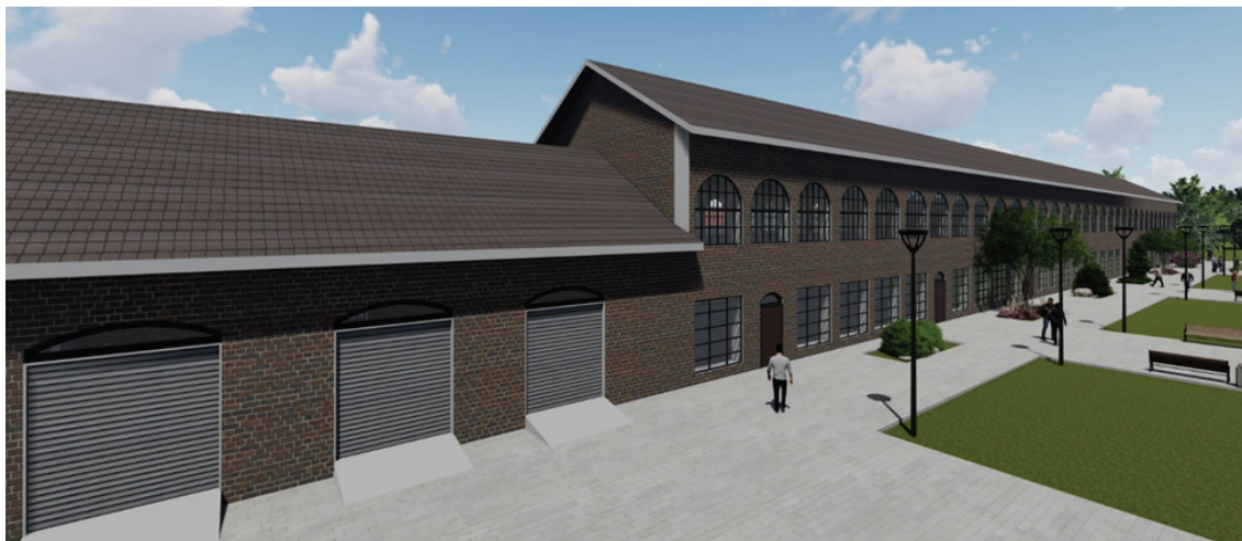
Рисунок 3 – Визуализация фасада здания учебных мастерских после реконструкции вид – 1.