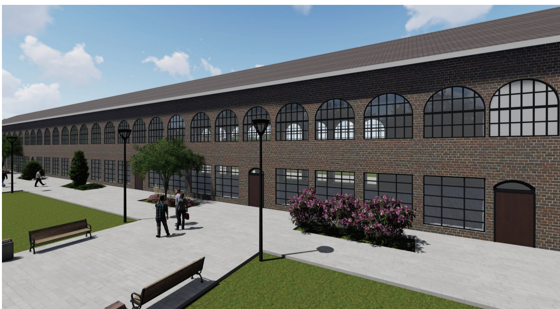
Рисунок 4 – Визуализация фасада здания учебных мастерских после реконструкции вид – 2.

Проблема развития данной территории очевидна – уцелевшая часть здания, являющегося нашим наследием прошлого в настоящее время, во-первых, является недоступной для посещения населением; во-вторых, не соответствует функциональному назначению осуществляемых процессов внутри здания. При этом перед нами стоит задача развития территории в соответствии с современными требованиями и потребностями населения. Так, рассматриваемую территорию можно преобразовать в ключе объединения прошлого и настоящего. Необходимо не только воссоздать первоначальный вид здания ярмарочных рядов, с целью сохранения памятника архитектуры, но и обеспечить доступность его посещения населением, (рис. 3).