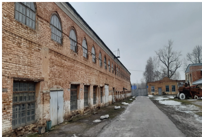
Рисунок 1 – Фотография фасада здания гостиного двора (в настоящее время отведено под учебно-производственные мастерские).

Ярким примером могут служить исторически сложившиеся условия городской застройки, в которых появляются точечные объекты – элементы развития инфраструктуры, отвечающие современным требованиям, но идущие в разрез со сложившимся архитектурным решением. В данной работе проблема развития инфраструктуры городов и поселений рассматривается на примере здания, эксплуатируемого в настоящее время в качестве учебных мастерских Свободинского аграрно-технического техникума имени К. К. Рокоссовского рис. 1, ранее здания большого Ярмарочного дома в стиле классицизма с двумя полукруглыми крыльями-рядами рис. 2.