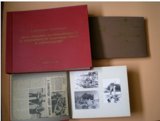
Альбомы конференции, стройотряда, выпускников