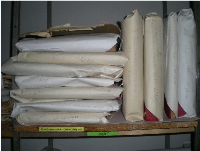
Альбомы научных конференций