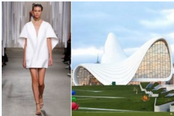
Платье Мишель Смит и архитектура Захи Хадид

Американка Роза Ассулин создает сложносложенные по-голливудски восхитительные вещи. На создание этого платья ее вдохновил архитектурный ансамбль гробницы рода Брион в Сан Вито д'Ативоле – проект великого венецианского архитектора Карло Скарпы. «Все геометрические элементы гробницы смотрятся невероятно гармонично. Сколько бы я на нее ни смотрела, мне каждый раз удавалось отыскать для себя что-то новое», – говорит Ассулин.