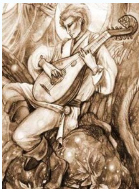
Примерно так представляли в легендах Томаса-Рифмача

Однако красивая теория о таком невероятном родстве разбилась в 2014 году, при анализе ДНК выяснилось, что современные Шотландские Лермонтовы не имеют ничего общего с Михаилом Юрьевичем. Учёные не обнаружили нужного сходства потомков Лермонтов и Лермонтовых. А значит, поэт зря сочинял в 1831 году стихотворение «Желание» о своих шотландских предках.