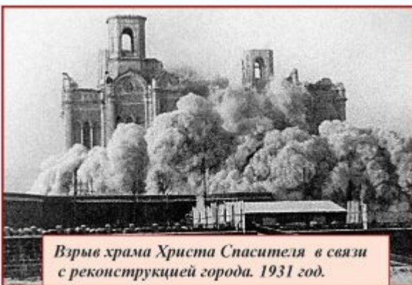
Взрыв храма Христа Спасителя в связи с реконструкцией города. 1931 год.

Еще в 1829 году в Санкт-Петербургской Академии художеств рассматривался вопрос создания в Москве храма Христа Спасителя. Он задумывался как грандиозный памятник победы над Наполеоном. Было объявлено несколько конкурсов, в которых приняли участие московские и питерские архитекторы. В итоге в конце 1831 года Николай I вызвал Тона в Москву и поручил ему проектирование храма Христа Спасителя. Этот проект сделал Константина Андреевича архитектором номер