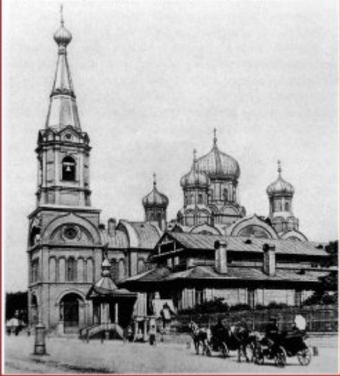
Церковь вмц. Екатерины (Екатерингофская)

Фирменный стиль Константина Тона оформился во время работы над московской церковью Екатерины Великомученицы. (Снесена в 1929 году)