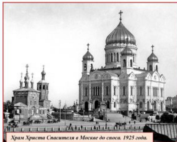
Храм Христа Спасителя в Москве до сноса. 1925 года.

Строительство храма длилось 44 года (1839 – 1883 гг.), и на момент освящения в 1883 году он был самым большим в России. Здесь могли разместиться 10 000 человек, высота здания составляла 103 м (выше, чем Исаакиевский собор), а площадь внутренних росписей – 22 000 квадратных метров, 9000 из которых были позолочены. Собор расписывали и оформляли лучшие мастера России: художники Суриков, Крамской, Верещагин и другие, скульпторы Иванов, Ромазанов, Клодт и Логановский. Всеми работами лично руководил Тон, и никаких нареканий к нему никогда не возникало.