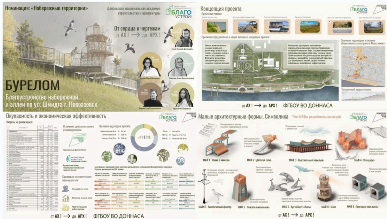
Проект, разработанный студентами ДонНАСА

Донецкие архитекторы разрабатывали проект набережной в Новоазовске с учетом сложного рельефа местности. Кстати, общая площадь проектирования и благоустройства увеличилась почти в 3,5 раза, в сравнении с первым вариантом.