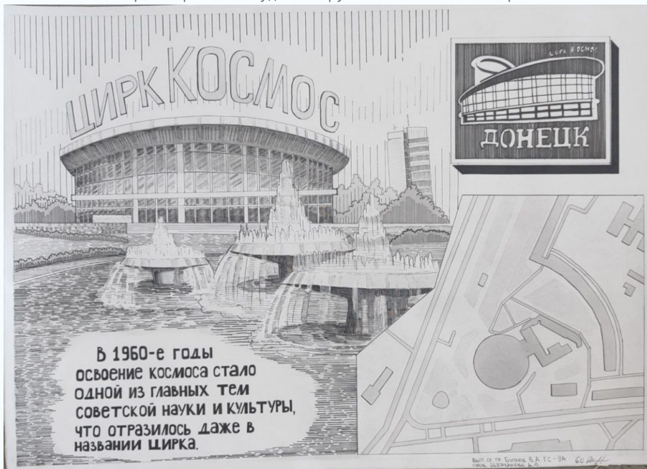
Битков (ст.гр. ГС-9).

На фото: работа студента группы РРАН-2а О.В. Вартапетян.