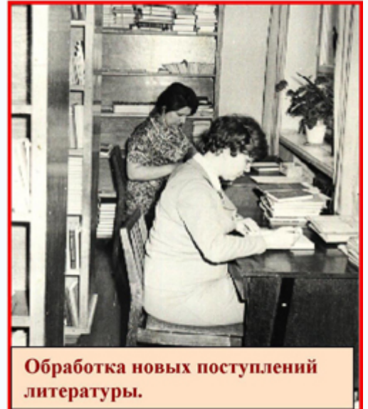
Обработка новых поступлений литературы.

В 1972 году библиотека была отделена от НТБ ДПИ и получила право самостоятельного планирования своей работы и комплектования фонда (Книжный фонд библиотеки составлял – 114 тыс. экз. ). Расширились помещения библиотеки – к этому моменту библиотека уже имела 4 комнаты под книгохранилище и большой читальный зал. К 1972 году, к моменту образования МИСИ (Макеевский инженерно-строительный институт), в библиотеке работало 13 квалифицированных сотрудников.