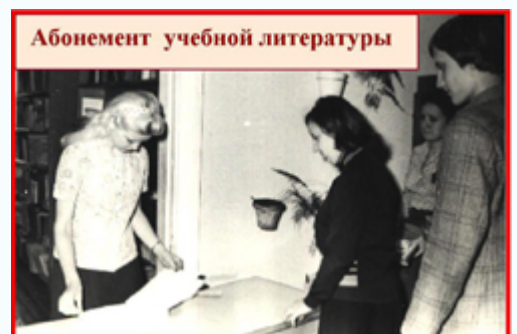
Абонемент учебной литературы