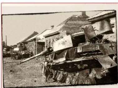
Подбитый немецкий танк на улицах Макеевки 1943 год