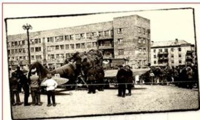
Сбитый советский самолет у оперного театра в оккупированном Сталино, 1941-43 гг.

Остановитесь на мгновение на цифре 700, ее легко написать и произнести. А прожить? Поэтому 8 сентября для нас – день торжества и памяти, гордости и скорби, праздник освобождения.