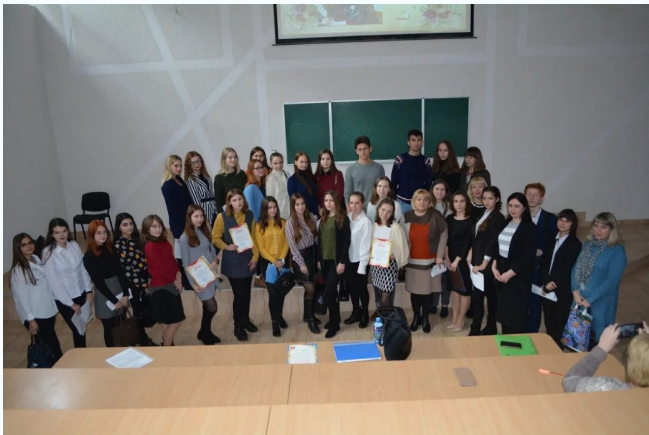
Коллектив кафедры прикладной лингвистики и межкультурной коммуникации