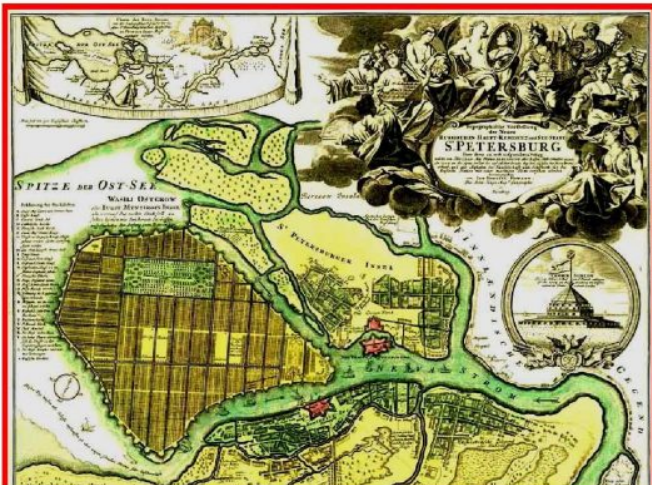
План Санкт-Петербурга с проектом планировки Васильевского острова, подготовленным Д.Трезини (автор Хофмани, Нюрнберг), 1717 г.