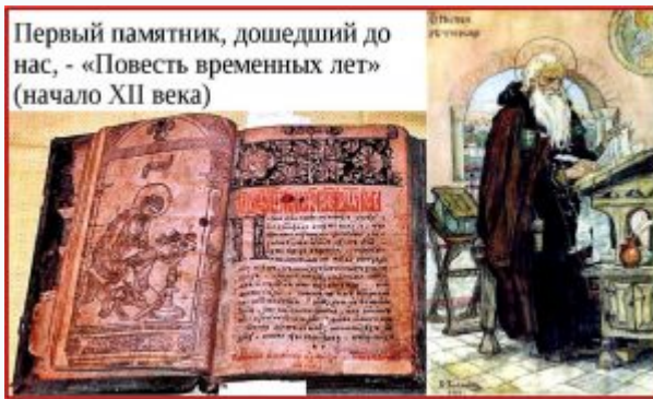
Первый памятник, дошедший до нас, - «Повесть временных лет» (начало XII века)

«Откуда есть пошла славянская письменность»