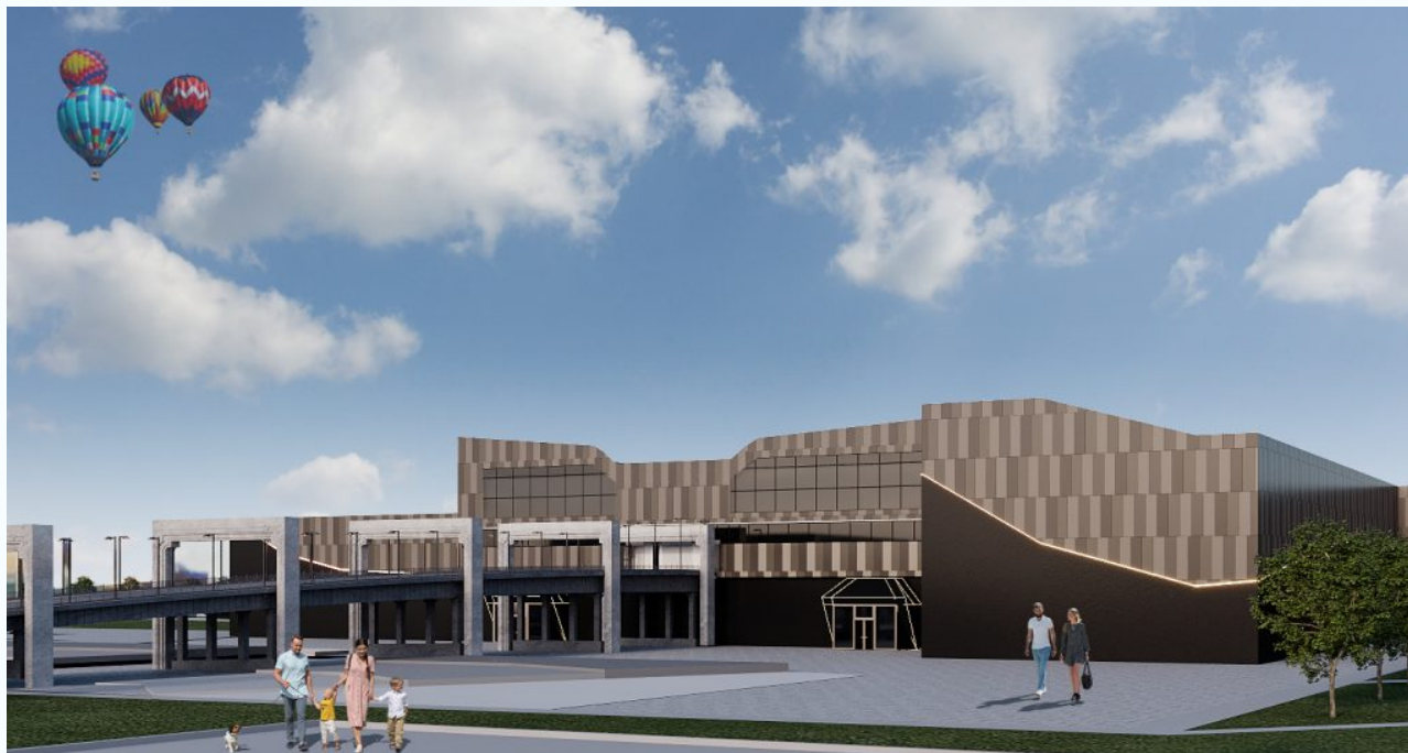
– Радиотелевизионная передающая станция в городе Донецке (автор: Вибль Владимир);