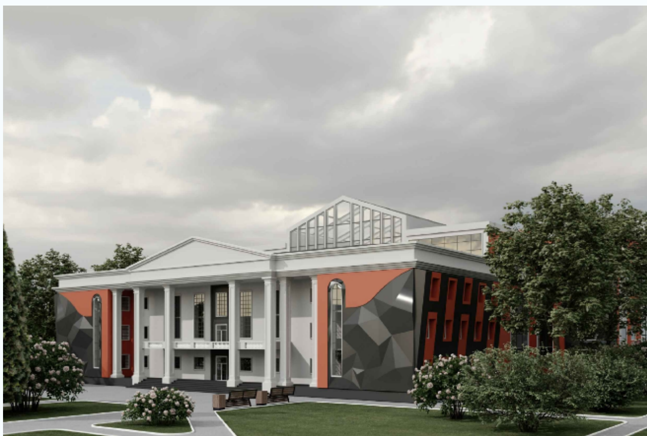
– Реконструкция выставочного центра «ЭКСПОДОНБАСС» в городе Донецке (автор: Шопяк Татьяна);