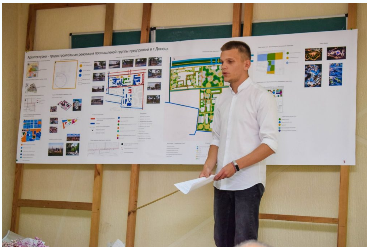
«Градостроительное формирование рекреационных зон Кировского района г.