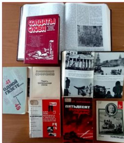
Фото- и радио репортёры, пишущие журналисты всегда находились на передовых участках. Они в числе первых врвались в города, сидели вместе с бойцами в окопах, делили с ними все невзгоды, рисковали жизнью, первыми описывали события по горячим следам, оставляя содержание своих материалов таким, каким оно было, с их тогдашним видением и мироощущением, не переосмысливая его и не приспособливая к нынешнему пониманию войны.

Фронтовые корреспонденты прошагали дорогами войны от Москвы до Берлина и сохранили для будущих поколений память о войне. (На фронтах Великой Отечественной войны погибло более 1500 представителей этого цеха).