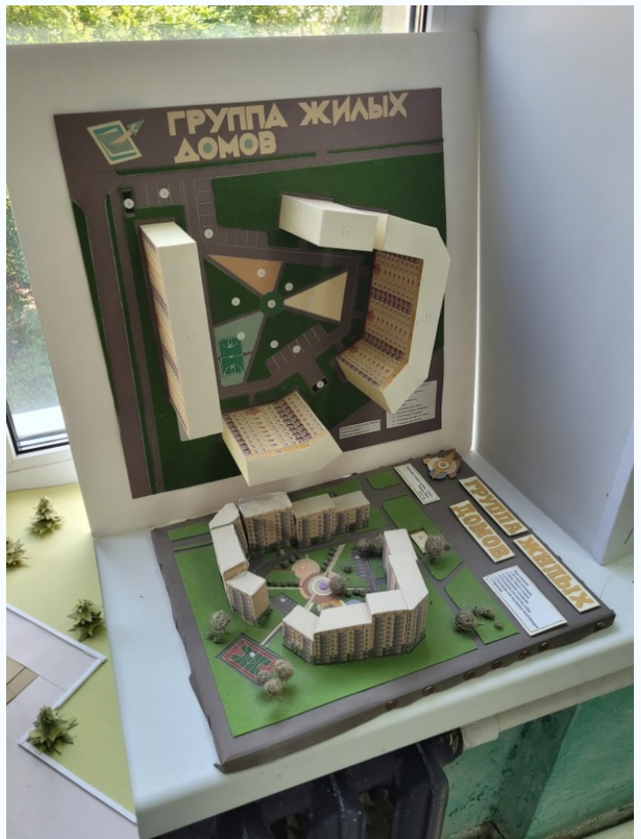
Примеры учебных работ учащихся колледжа