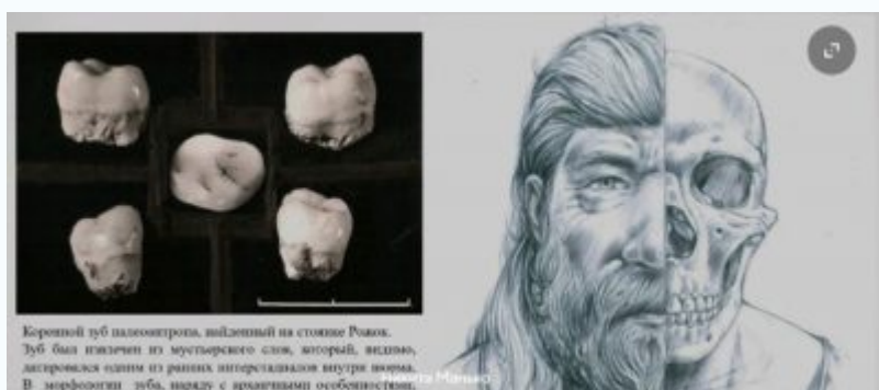
Короновый зуб палеолитовца, найденный на стоянке Ровох. Зуб был гашлен из мускульного слюны, который, видимо, застрял в одном из ранних интерстахов внутри корня. В морфологии зуба, наряду с яркими особенностями...