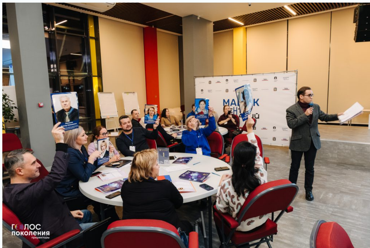
График очного этапа образовательной программы был очень насыщенный и плотный: день начинался в 7:30 с ресурсных практик или спортивного трека, а завершался подведением итогов в 21:30. Все участники были разбиты на команды и при этом использовались различные технологии организации работы: лекции; формат «равный равному»; игра-сессия; обмен опытом «практика практик»; интервью со студентами и др.

занимались участники программы на протяжении трёх очных модулей.