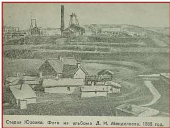
Старая Юзовка. Фото из альбома Д. И. Менделеева. 1888 год.

В Юзовке Дмитрий Иванович осмотрел металлургический завод и шахту при нем. Ученый интересовался оборудованием цехов, качеством производимого металла, условиями труда металлургов и горняков. Пытаясь облегчить труд горнорабочих Донбасса, Менделеев придет к смелому научному открытию – подземной дегазации угля. После посещения предприятий «Новороссийского общества» Д.И. Менделеев сказал Джону Юзу следующие слова: «Вы совершили подвиг. Недавняя пустыня ожила.