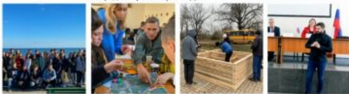
Реализация Международной программы развития городской «Темп пространства»