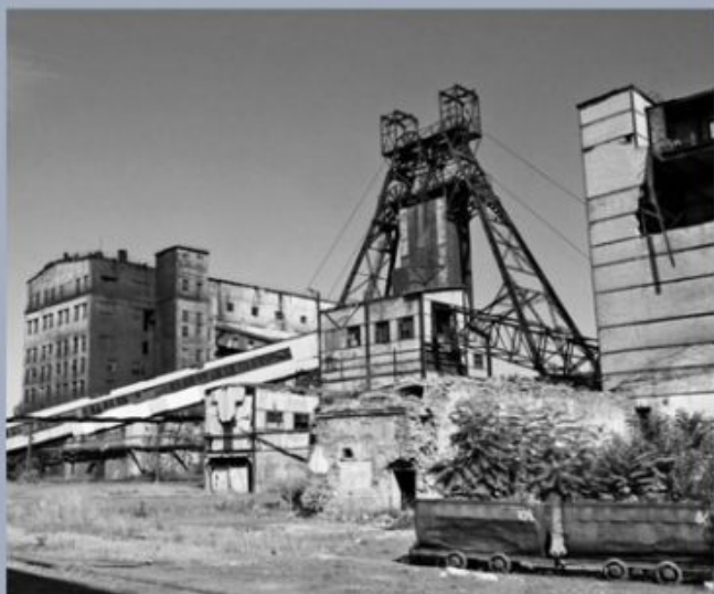
Шахта им. Ленина

Горные разработки Донецких шахт составляют уникальную систему подземных коридоров протяженностью более 2000 километров .