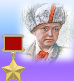
Фото Лени Голикова