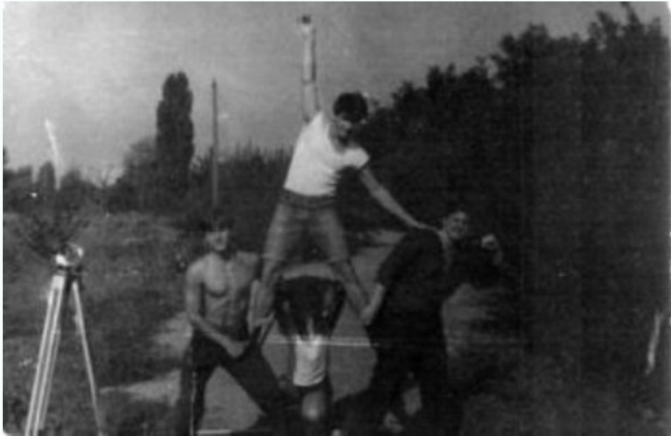
Группа ПГС-42 на практике по геодезии, 1989 г.