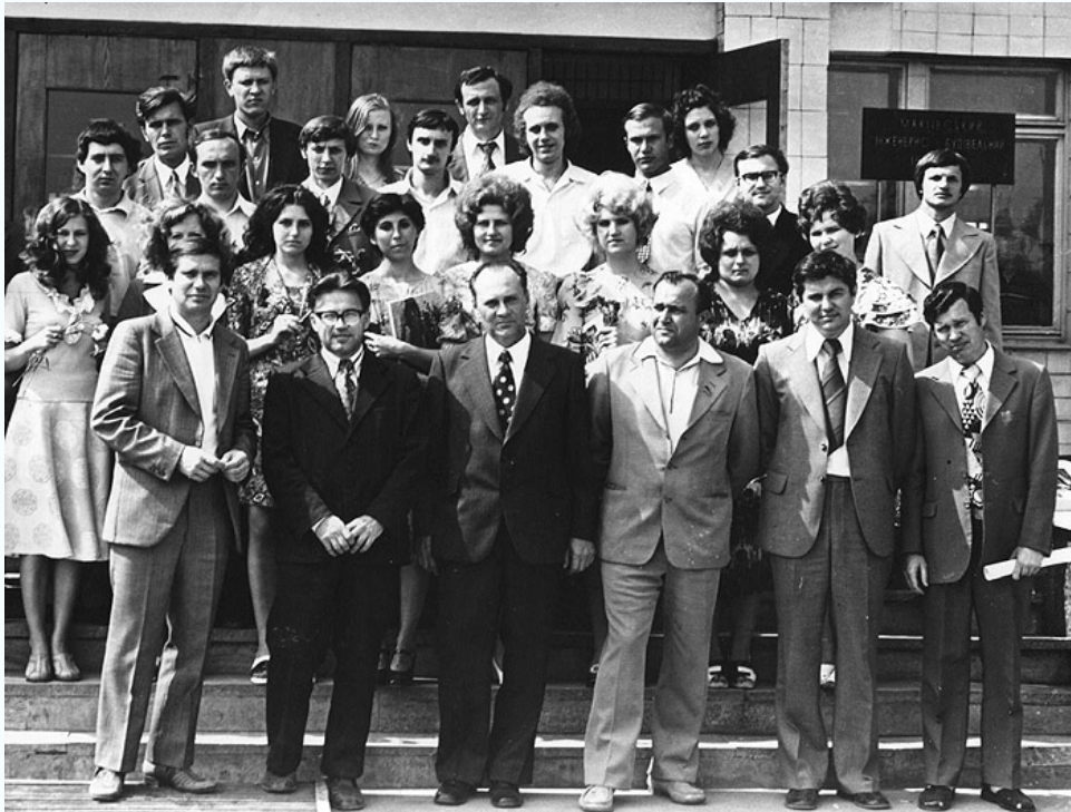
Преподаватели кафедры строительных конструкций с выпускниками на входе в 2-й учебный корпус МИСИ, 1973 г.