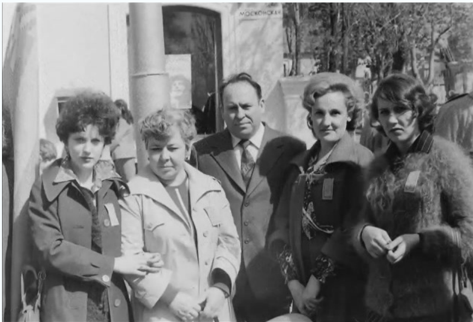
На демонстрации 1 мая