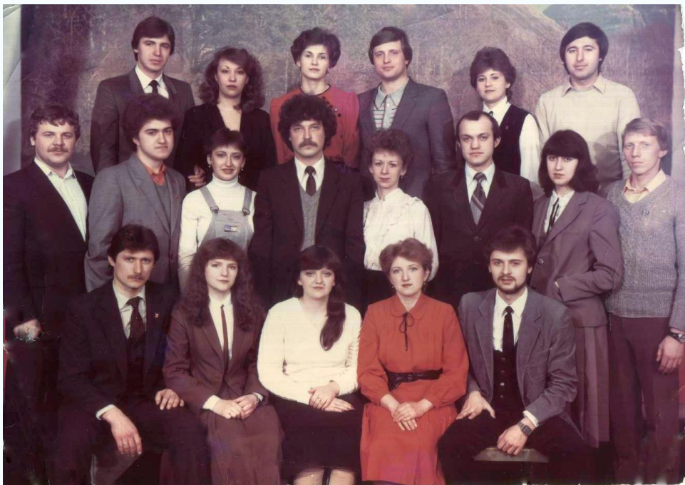
Группа ПГСМ-33, Дипломированные специалисты, 1984 г.