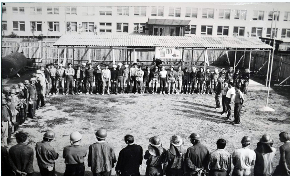
Главная сила стройки, 1972 г.