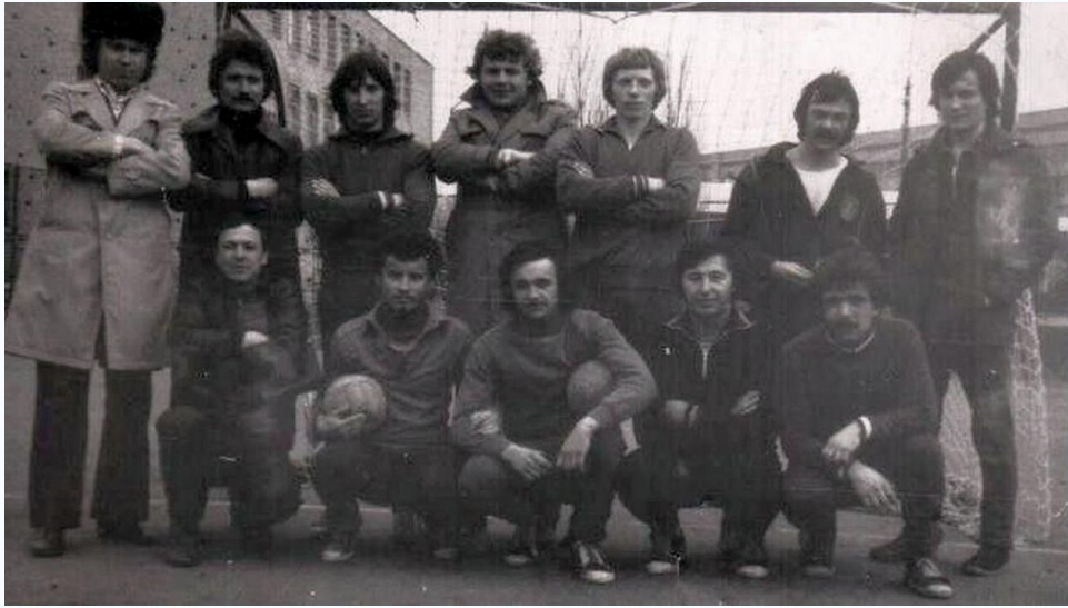
Чемпионы 2-го общежития по футболу между отсеками, 1982 г.