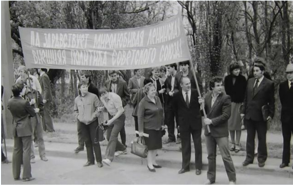
На демонстрации, 1984 г.