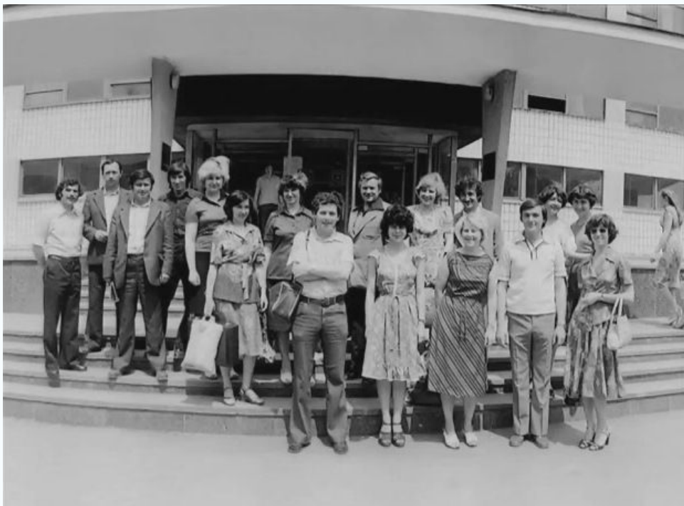
Выпускная фотография студентов группы ТГВ-236, 1980 г.