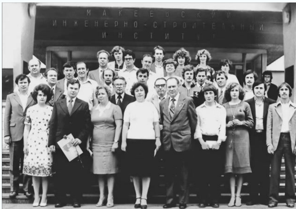
Администрация МИСИ с лучшими выпускниками, 1980 г.