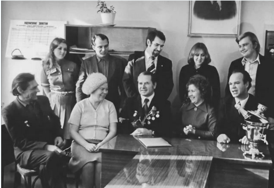
МИСИ, кафедра общей теплотехники, 1978 г.