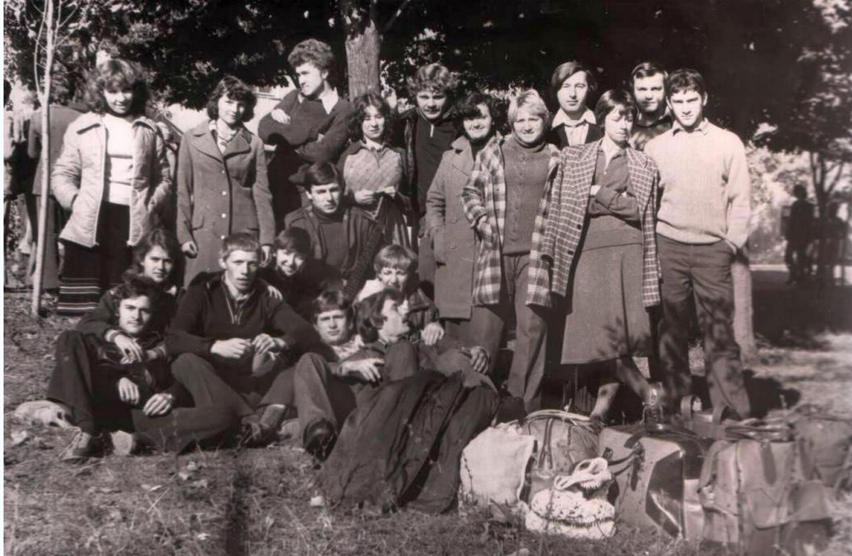
Студенты группы ПГСМ-33А, Колхоз ждет, 1979 г.