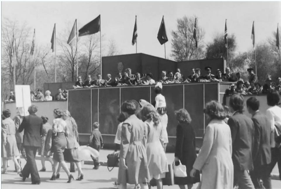
На демонстрации 1 мая