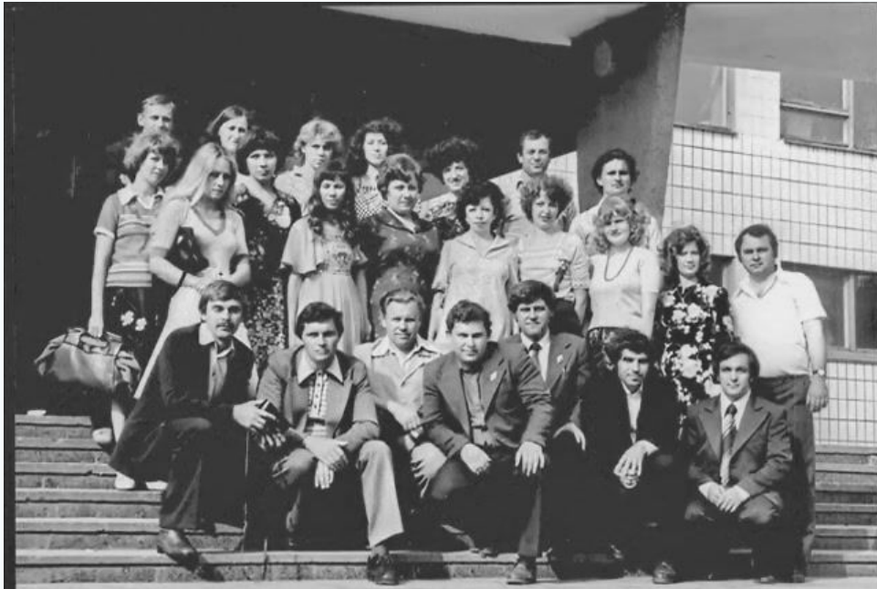
Выпускники на пороге 1-го учебного корпуса, 1980 г.