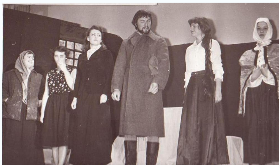
Студенческий театр, ПГС-33, 1979-1984 гг.