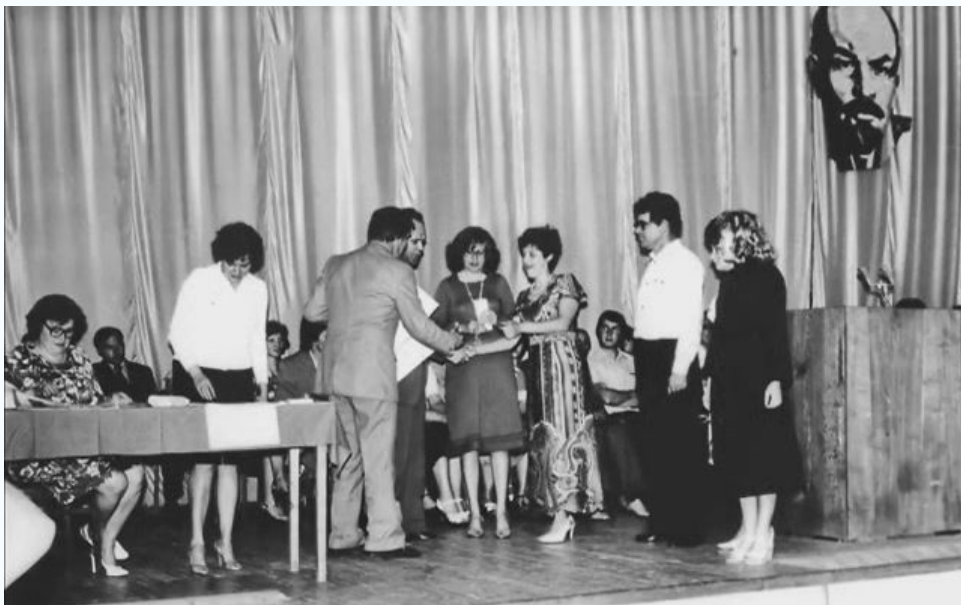
Макеевка МИСИ, 1980 г.