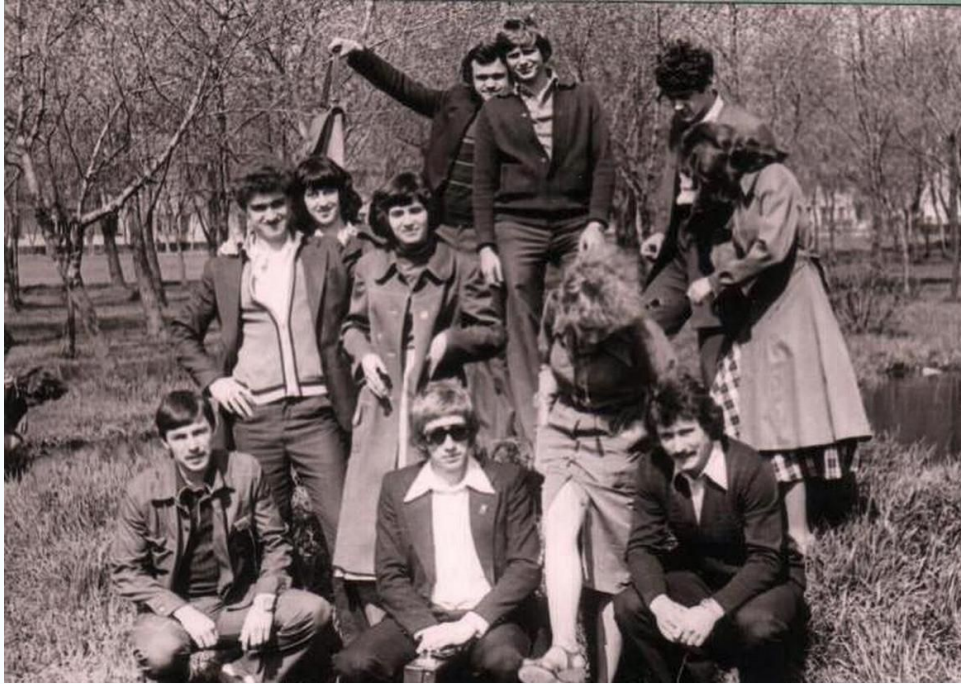
Студенты группы ПГСМ-33А, 1980 г.