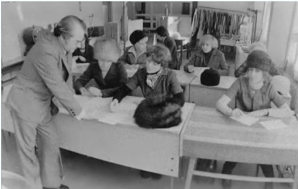
МИСИ, кафедра общей теплотехники, 1980 г.