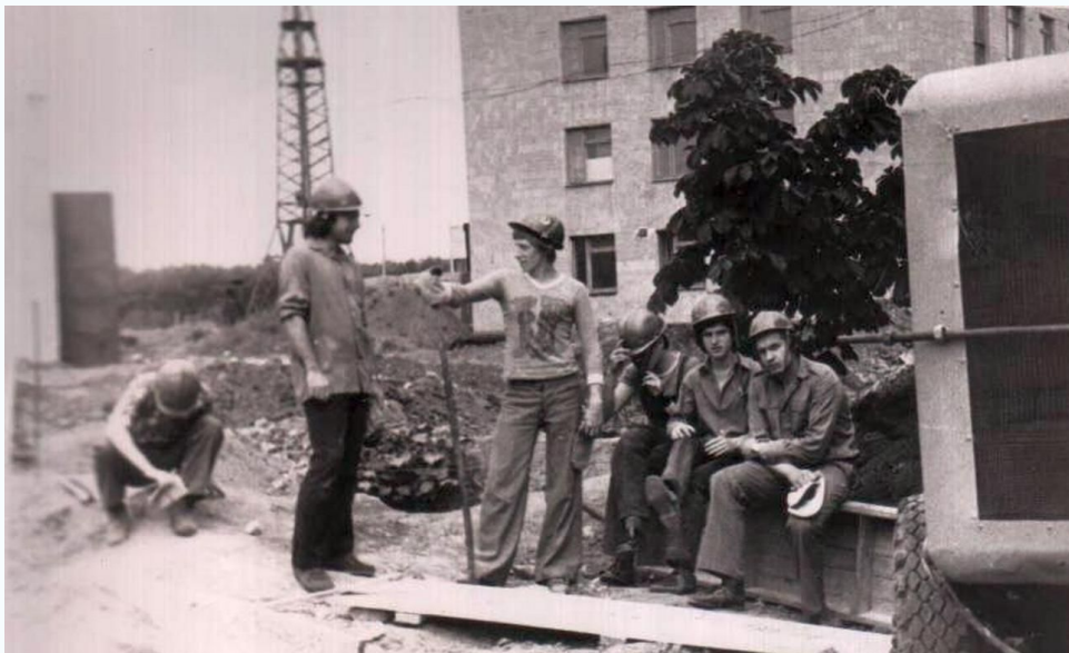
ПГСМ-33А, Строительство перехода между 2-м корпусом и столовой, 1980 г., Лето