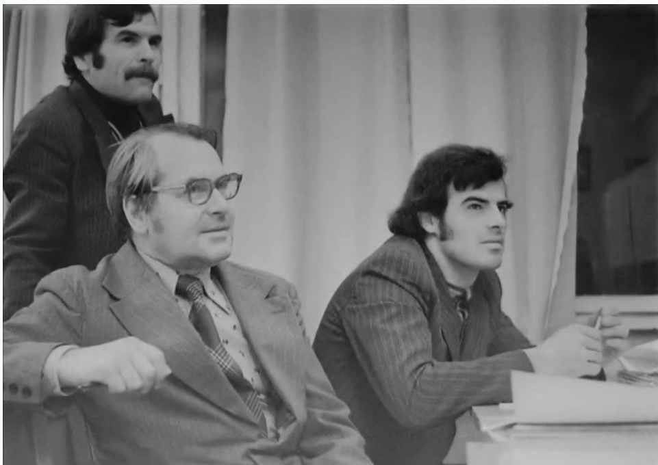
На занятиях по теплотехнике, 1980 г.