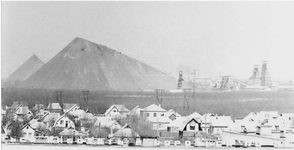
Поселок Ганзовка, 1976 г.