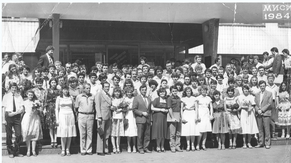
Выпуск ПГС-33, коллективная фотография 1984 г.