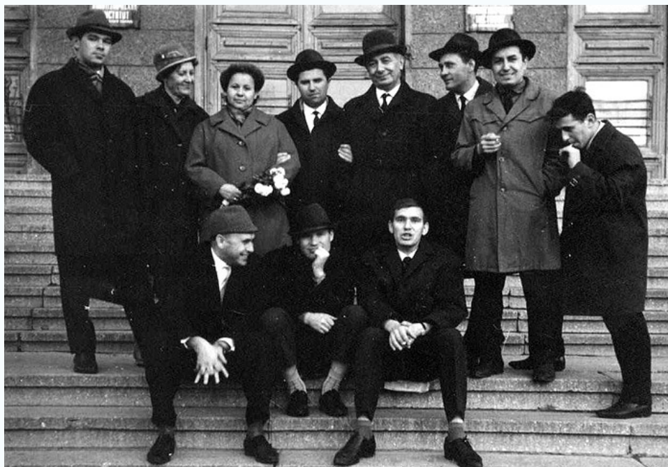
Кафедра строительных конструкций на входе в 5 учебный корпус ДПИ (ДонНТУ), 1965 г.