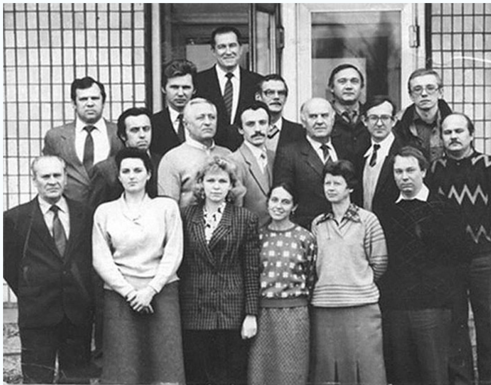
Кафедра железобетонных конструкций в составе 1988 г.