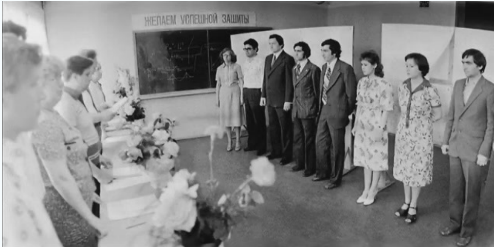
Выпуск кафедры общей теплотехники, 1980 г.