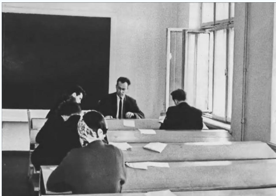
Макеевский филиал ДПИ, кафедра высшей математики, 1970 г.