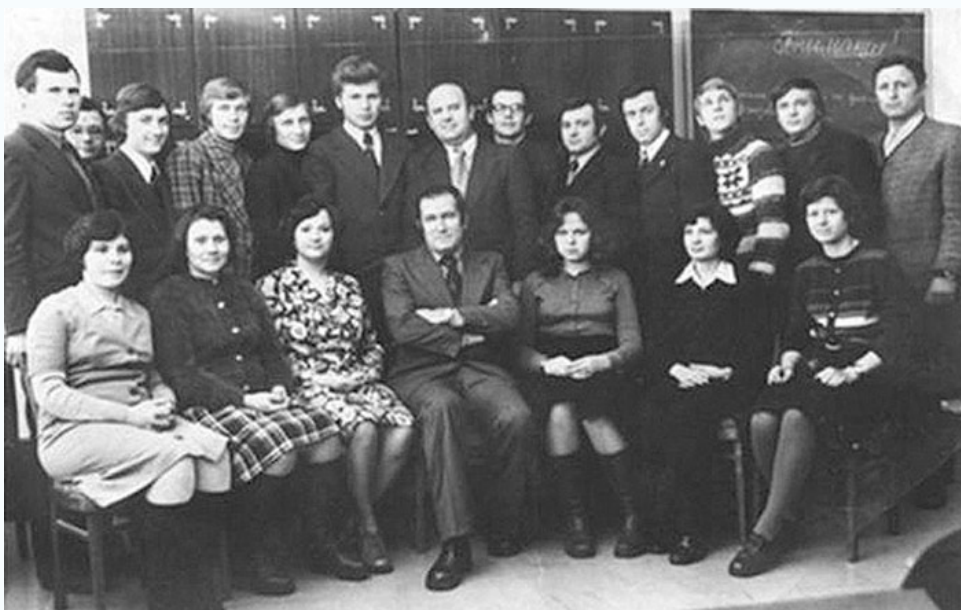
Кафедра железобетонных конструкций в составе 1975 г.