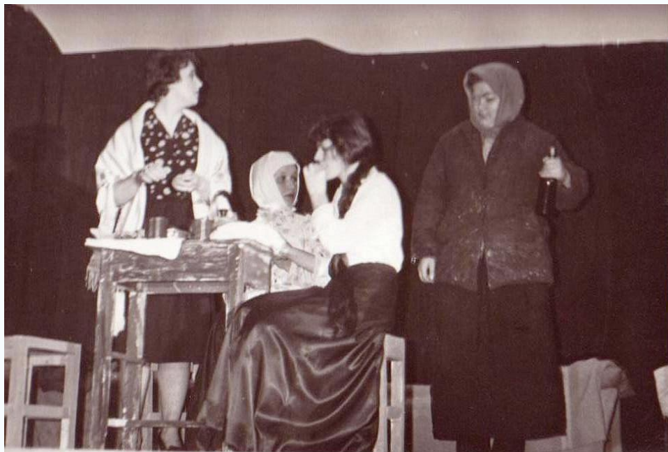
Студенческий театр, ПГС-33, 1979-1984 гг.