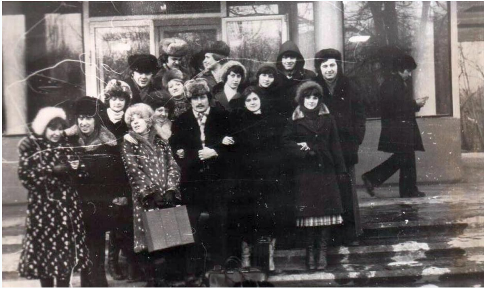
ПГСМ-33А, Первая сессия позади, 1980 г.