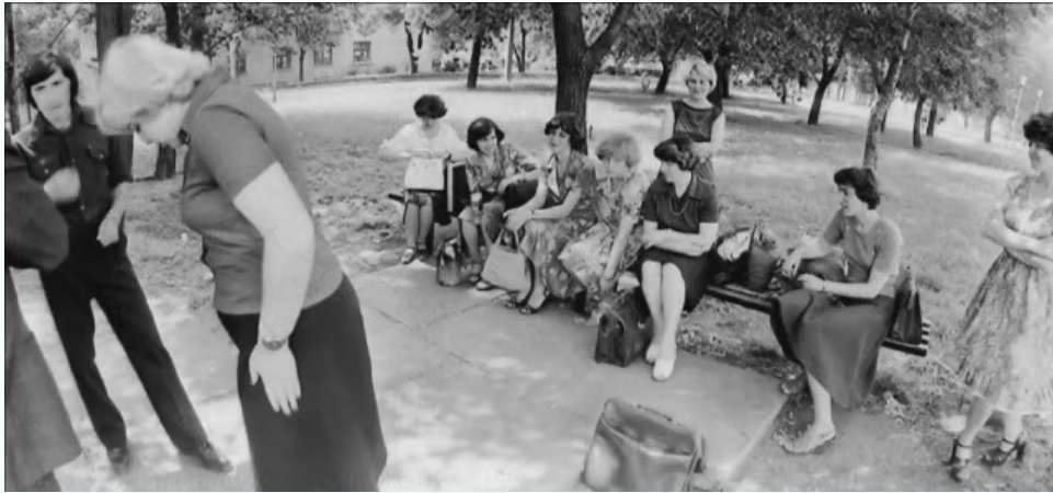
На перемене, 1980 г.