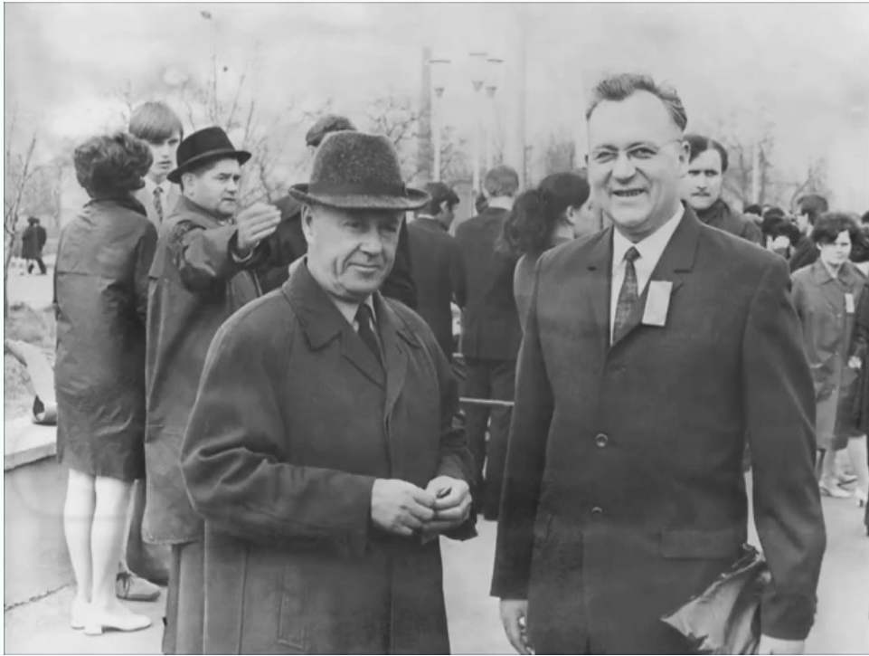
На демонстрации 1 мая