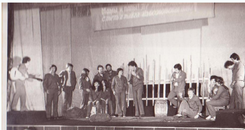
Студенческий театр, ПГС-33, 1979-1984 гг.