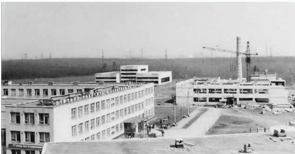
Вид с крыши учебного корпуса №1 на стройплощадку, 1976 г.