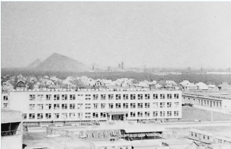
Вид с крыши корпуса №1 на учебный корпус №2, 1976 г.