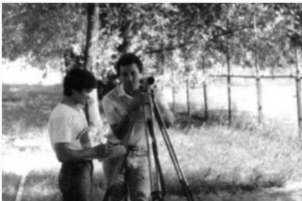
Группа ПГС-42 на практике по геодезии, 1989 г.