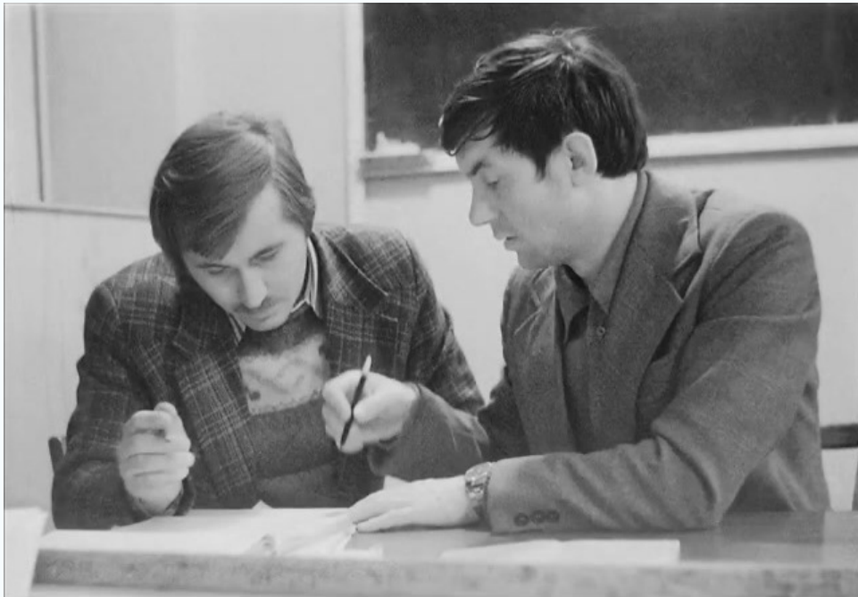
МИСИ, кафедра экономики, 1980 г.