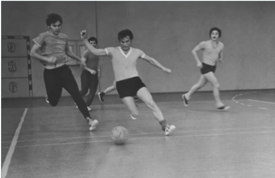
МИСИ, спортивный зал, 1979 г.