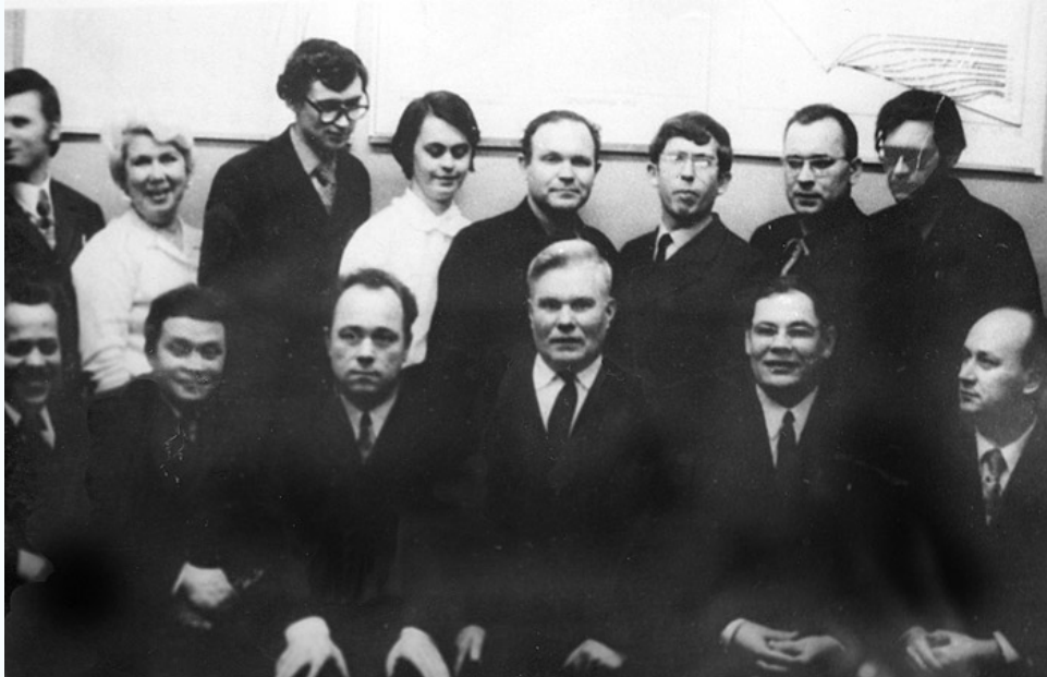
Ядро будущей кафедры водоснабжения и водоотведения, 1972 г.