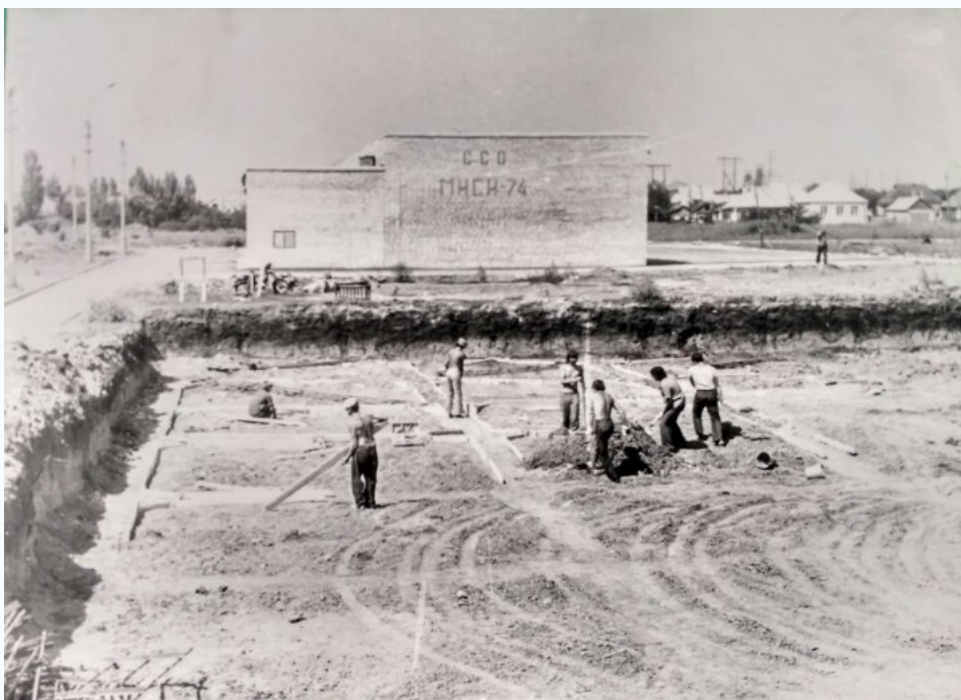
Котлован студенческой столовой МИСИ, 1976 г.