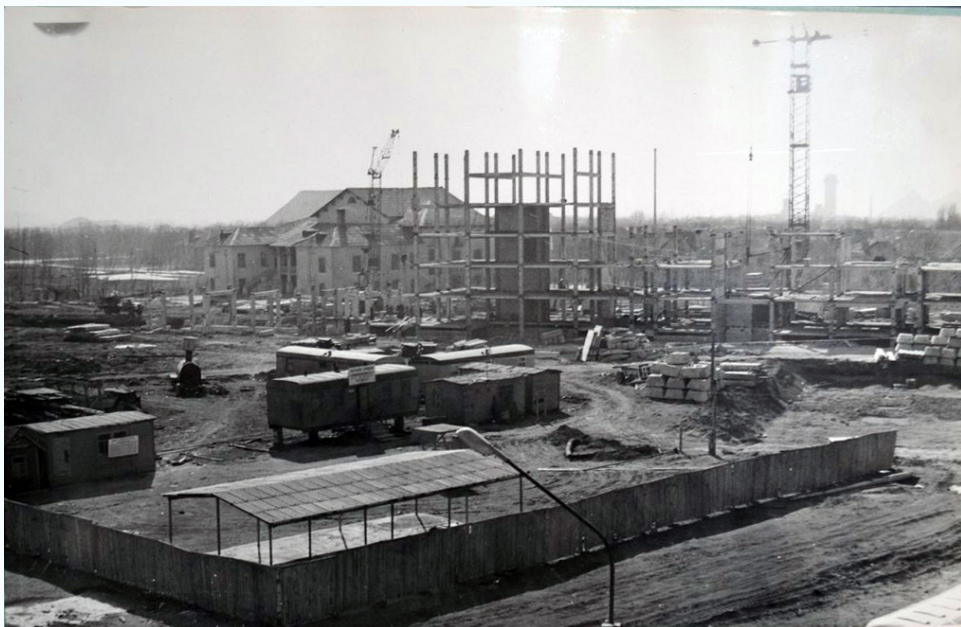
Общий вид строительной площадки МИСИ, 1972 г.