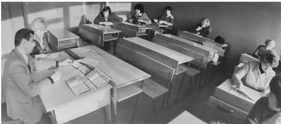
МИСИ, экзамен по теплоснабжению, 1980 г.