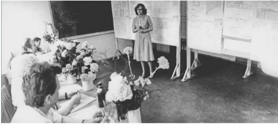
На защите дипломных проектов, кафедра общей теплотехники, 1980 г.