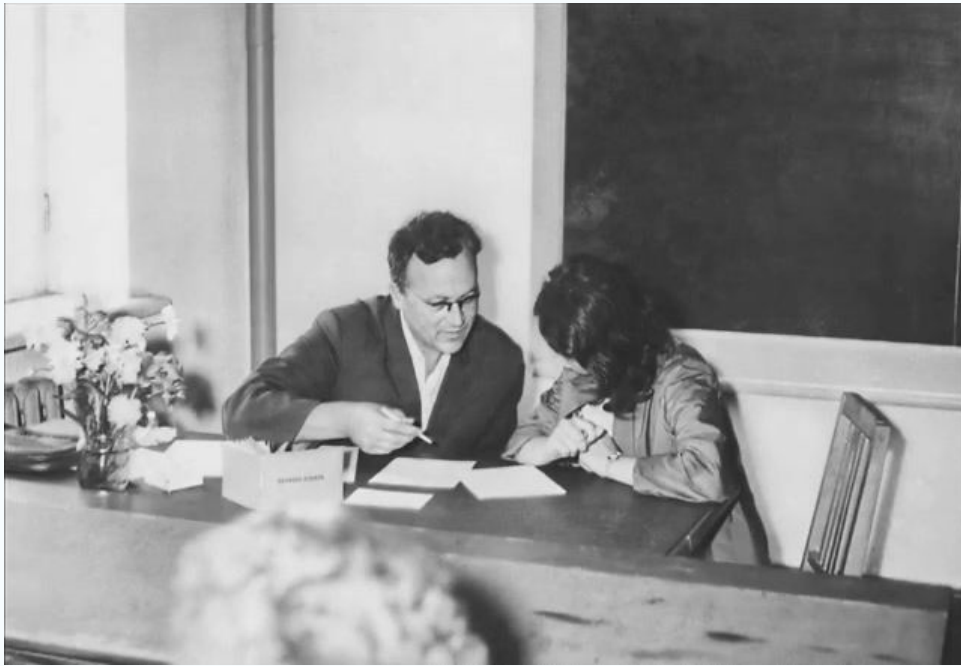
МИСИ, кафедра высшей математики, 1972 г.