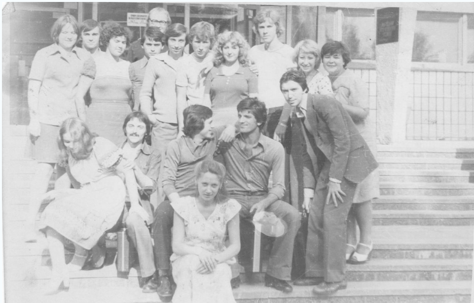
Группа ПГС-33, 1979-1984 гг.