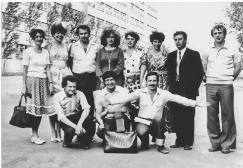
Выпускники кафедры общей теплотехники, 1980 г.