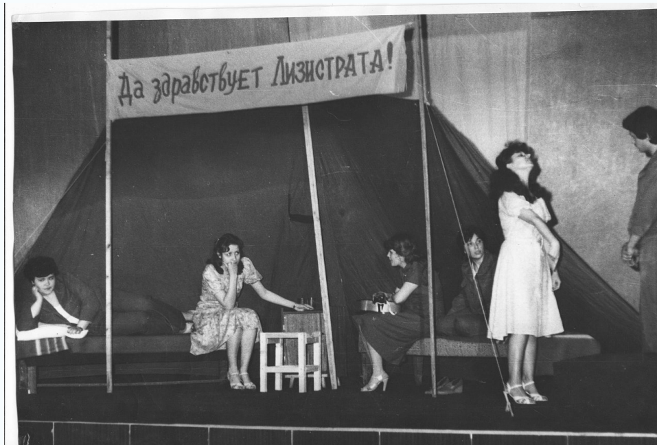
Студенческий театр, ПГС-33, 1979-1984 гг.