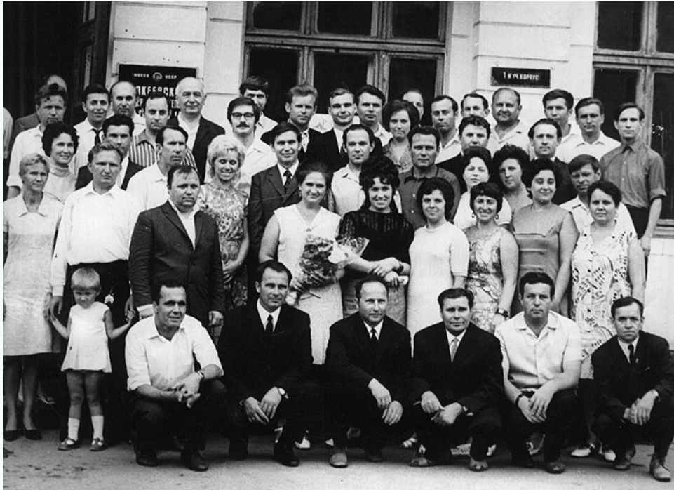
Преподаватели кафедры строительных конструкций с выпускниками (Кировская сторона, 1972 г.)