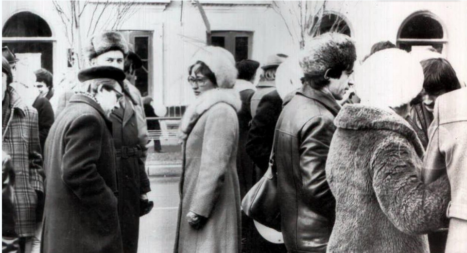
На демонстрации, 7 ноября 1980 г.