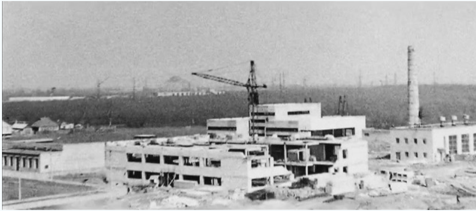
Строительство студенческой столовой, 1976 г.