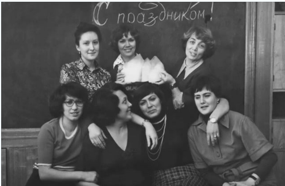
МИСИ, кафедра механики грунтов, 1978 г.