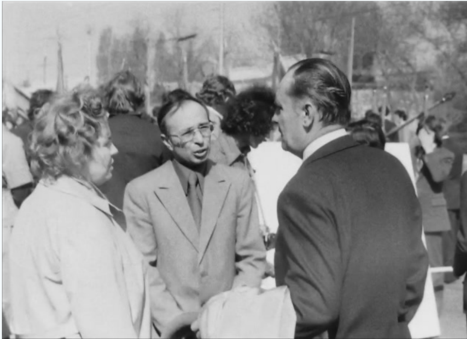
На демонстрации 1 мая