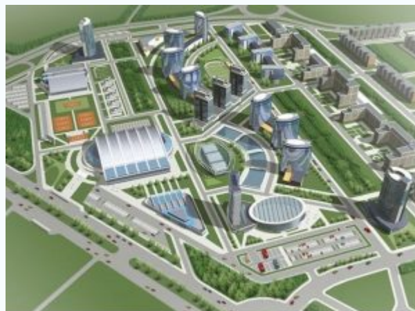
Примеры градостроительных работ, созданных с помощью графических редакторов

Архитекторы-реставраторы – разносторонние специалисты, которые осуществляют архитектурно–реставрационную деятельность в области сохранения, использования и популяризации объектов культурного наследия с территорией памятников, ансамблей и достопримечательных мест, историко–культурной среды обитания городов и поселений; научные исследования, проектирование и авторский надзор за производством работ по сохранению объектов культурного наследия и работ на объектах в зонах охраны объектов культурного наследия. При этом они: