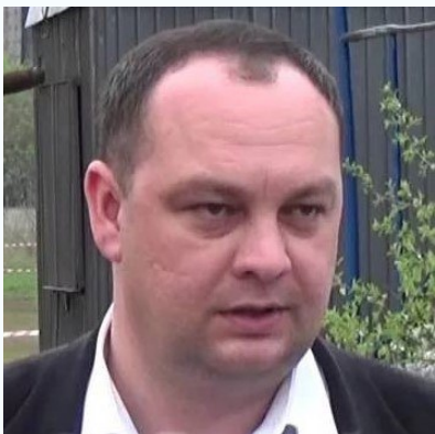
Теряев Руслан Иванович – директор департамента развития строительной отрасли Министерства строительства и жилищно-коммунального хозяйства Донецкой Народной Республики