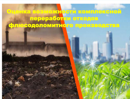
Количество отходов, образовавшихся на территории РФ с 2009 по 2018 гг

в) результаты исследования могут быть использованы для создания технического регламента процесса производства тротуарной плитки на основе отходов флюсо-доломитного производства по методу полусухого прессования.