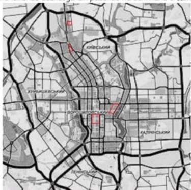
Расположение исследуемых районов на генплане г. Донецк