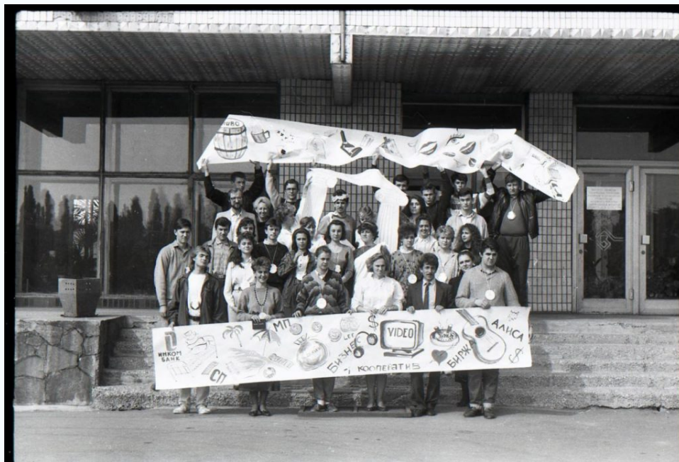
Студенты группы Ар-15 со своими преподавателями, 1996 г.

Становление академии. Исторические кадры и фотографии