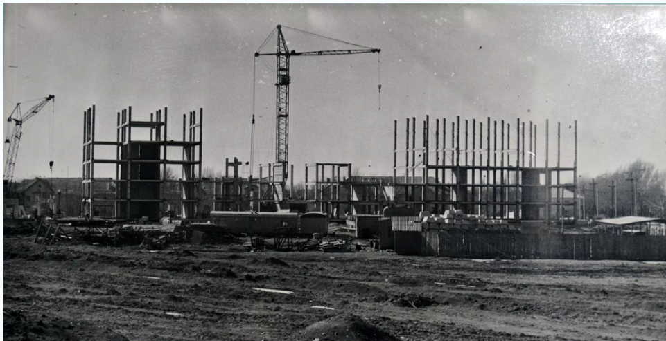
Монтаж каркаса главного учебного корпуса №1, 1973 г.