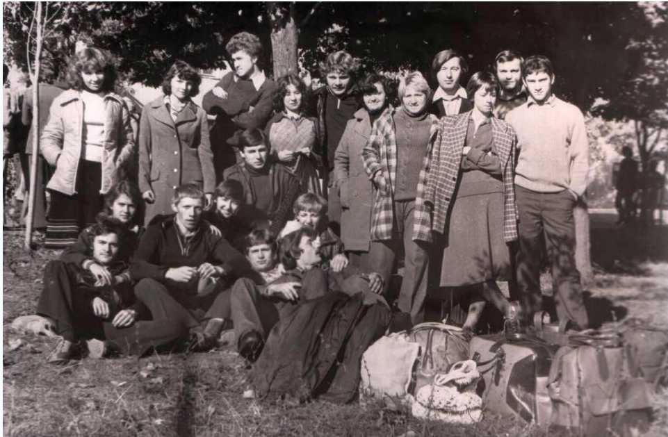
Студенты группы ПГСМ-33А, Колхоз ждет, 1979 г.